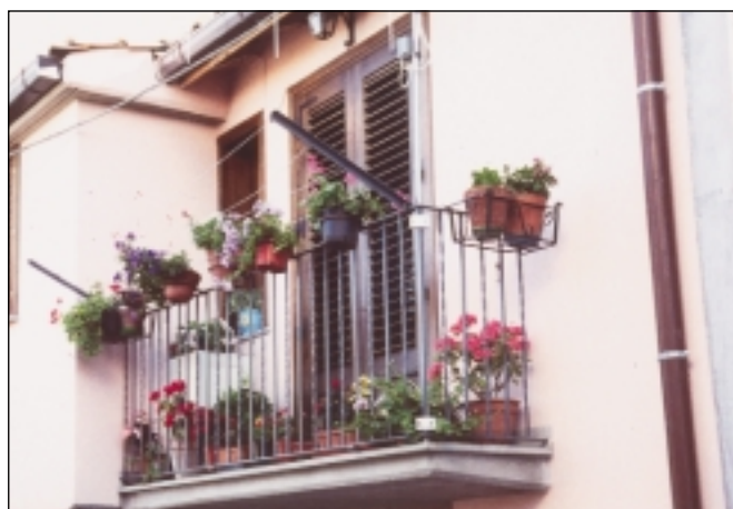
.....in Via Sant'Antonio.