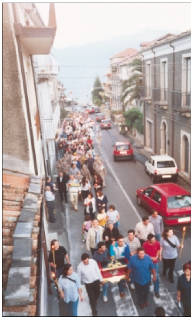
23 Agosto 2001 – Processione per l'arrivo da Tropea dei resti mortali di Santa Domenica.