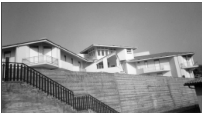
La Casa Albergo per anziani.

Particolare attenzione è stata indirizzata al fine di