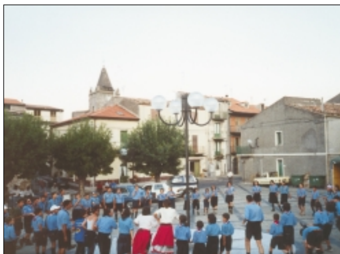
Agosto 2001 – Raduno di Boy Scouts a Santa Domenica Vittoria.