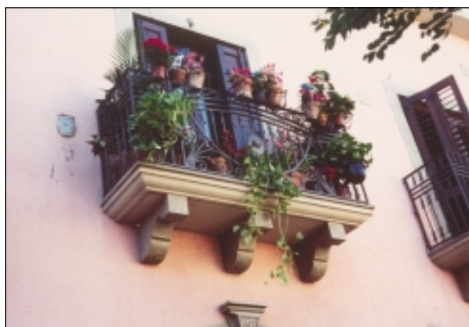
.....in Piazza Fogliani.