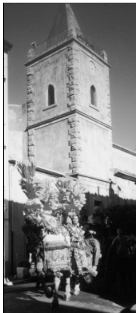
22 Luglio 2001: il carro infiorato in via Sant'Antonio.....