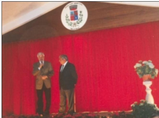
4 Aprile 2001 – Inaugurazione del palco per manifestazioni e convegni presso il "Centro Diurno per Anziani".