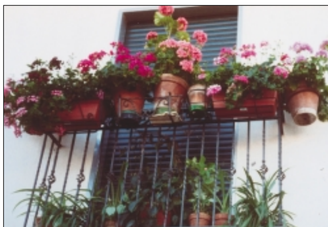
.....in via San Rocco.