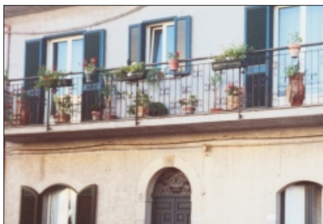
.....in Via Libertà.