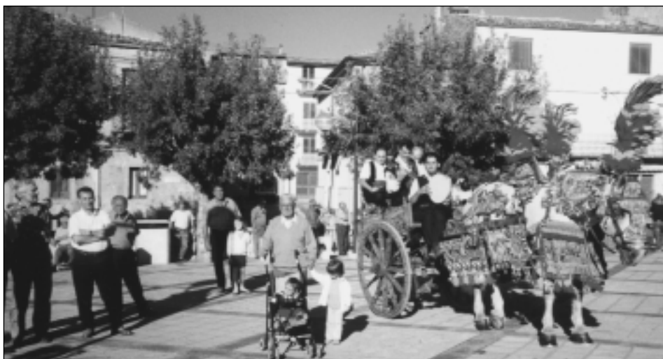
.....ed in Piazza Marconi