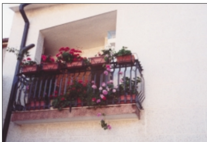
.....in Via Regione Siciliana.