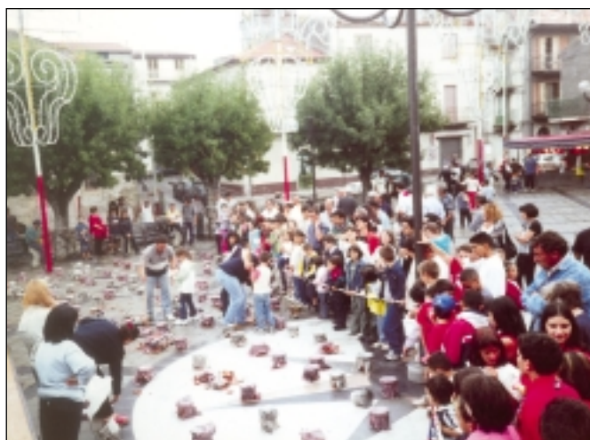
26 Agosto 2001 – Festa di Santa Domenica: "I pignati".