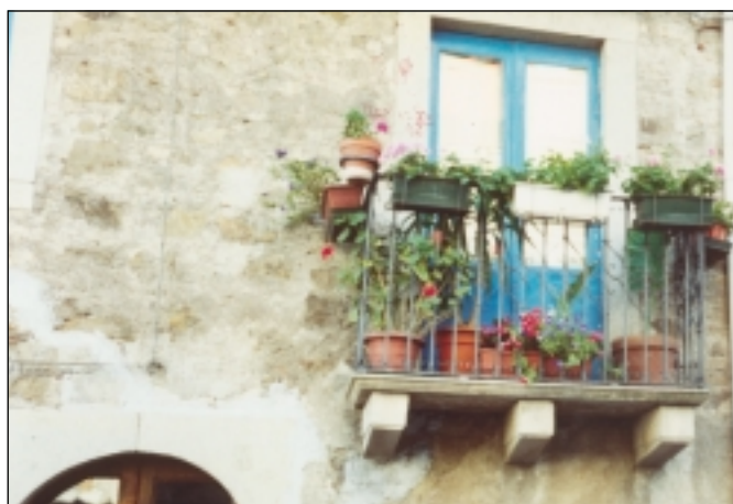
.....in Via Vittoria.