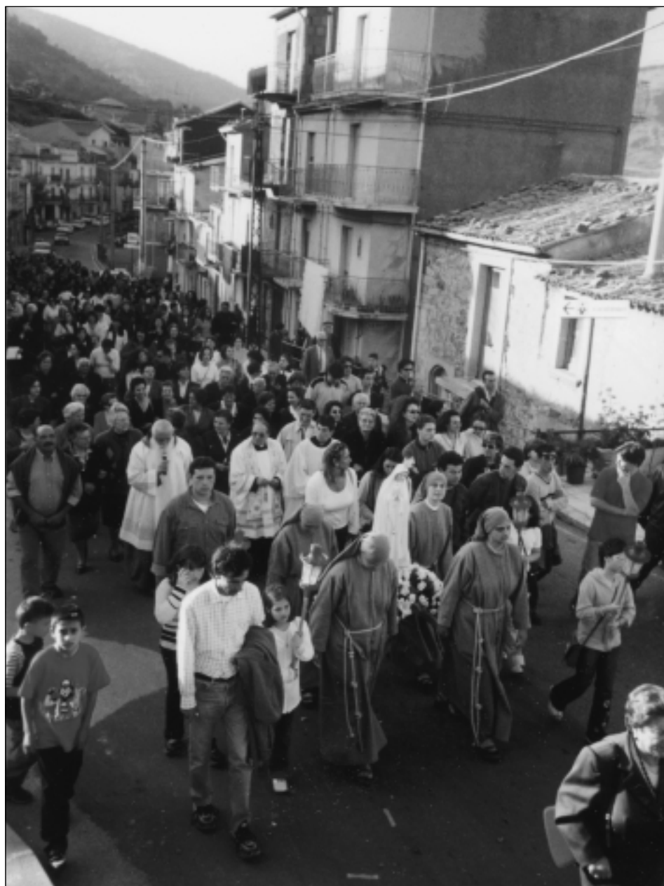
Un momento della processione.