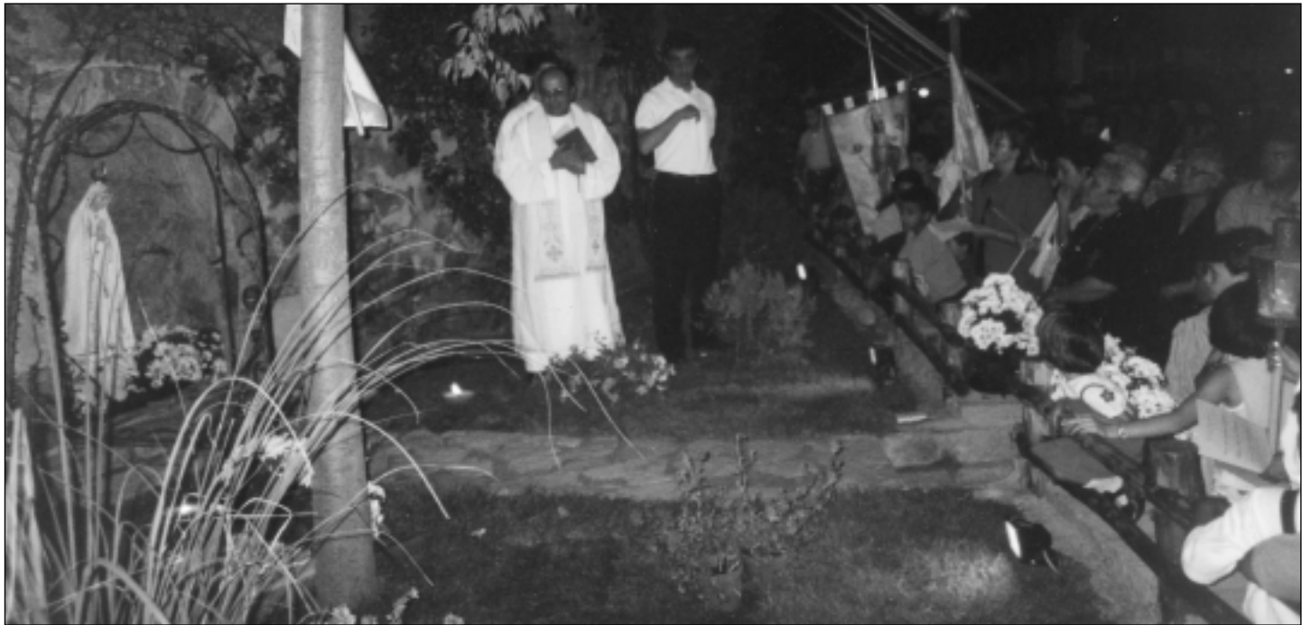
La statua della Madonna, venerata dai devoti, subito dopo essere stata adagiata nella sua grotta.