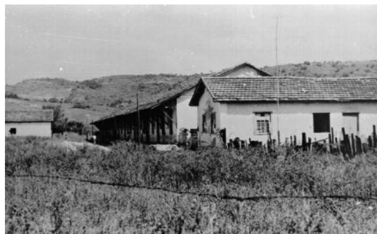
Galpão onde eram guardadas as mercadorias da navegação