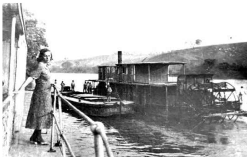
Vapor ancorado às margens do Rio Grande e outro descendo