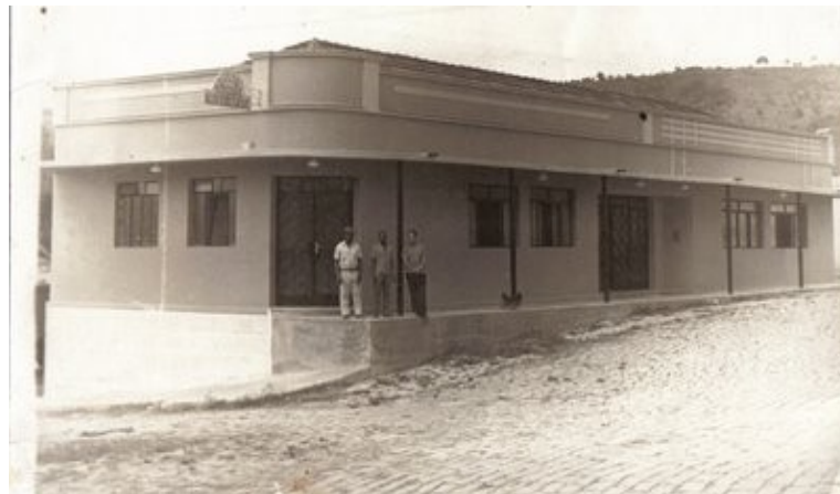
Clube Social Ribeirense