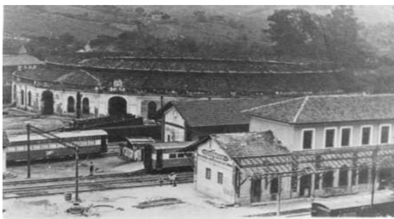
Estação e Rotunda