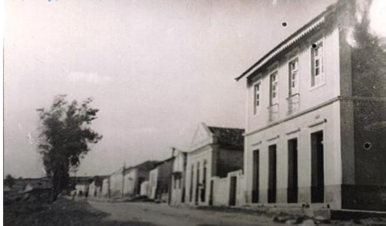
Avenida 26 de novembro – 1925