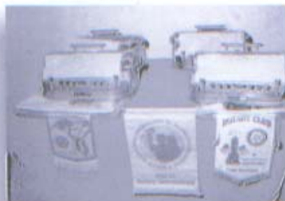
Equipamiento para aula de Discapacitados Visuales de la escuela "María Montessori"