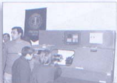
Torno Control Numérico Escuela IPEM N° 152 "Antonio Graziano" (ex ENET)