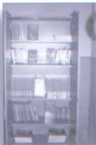
Inauguración de Biblioteca para escuela Alberdi"