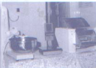
Maquinaria para Fábrica de pastas del Centro "Proteger"