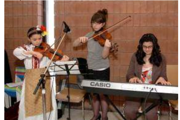
Sceneta de Primăvară