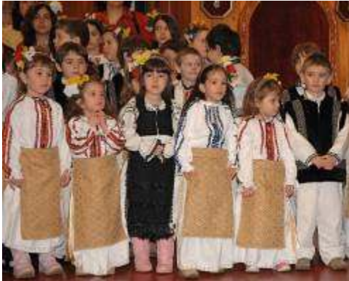
Copii la Sfânta Liturghie de Hramul Bisericii

Fiecare poarta in el o primavara din al carei zâmbet ce imprastie ghiociei am impletit un martisor, simbol al fericirii si eternitatii.