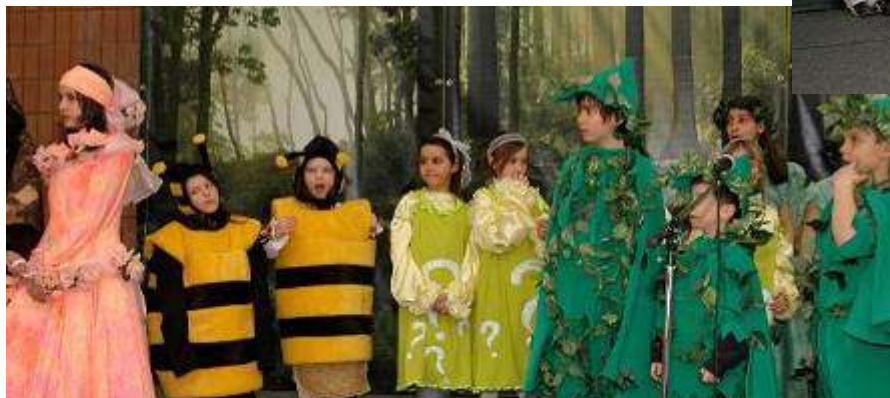
Sceneta de Primavara