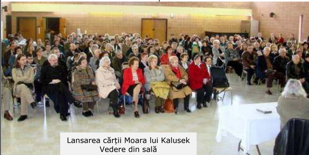
Lansarea cărții Moara lui Kalusek Vedere din sală

(prezentare făcută în 13 aprilie 2008 cu prilejul lansării volumului Moara lui Kalusek – începutul represiunii comuniste de Victor Roșca)