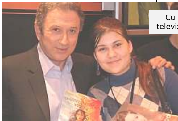
Cu cunoscutul prezentator de la televiziunea franceză Michel Drucker

Toujours enthousiaste et en même temps terre à terre. À n'importe quel moment et à n'importe quel endroit, Miruna Tarcau est capable de parler de ces travaux littéraires des heures et des heures, avec la même passion. Cette fois-ci, notre discussion c'est déroulée en mars, au Salon du livre de Paris, où la jeune écrivaine était présente pour la deuxième fois, avec son nouveau livre Le Choix de Selenæ , le premier tome de la saga fantastique La Guerre des Titans .