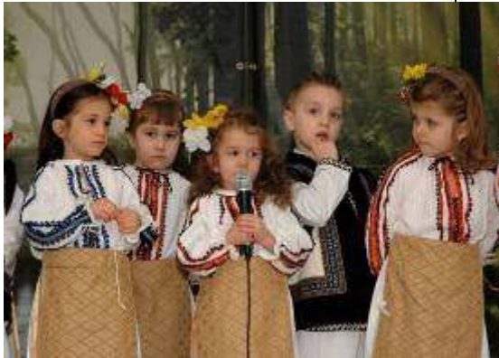
Poeziile și cântece, Clasa de 3-5 ani

În fața unui decor minunat, special creat pentru acest eveniment, copiii au interpretat cântece de primăvară și au dansat frumoasele dansuri românești Alunelul și Brăsoveanca. Îmbrăcați în costume deosebite, au prezentat și o scenetă având ca temă venirea primăverii.