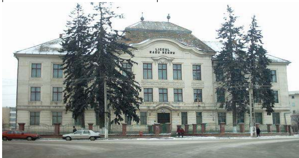
CANDELA DE MONTREAL

(preluat din „corespondențe” nr. 1(2), anul II, aprilie 2007, p. 12)