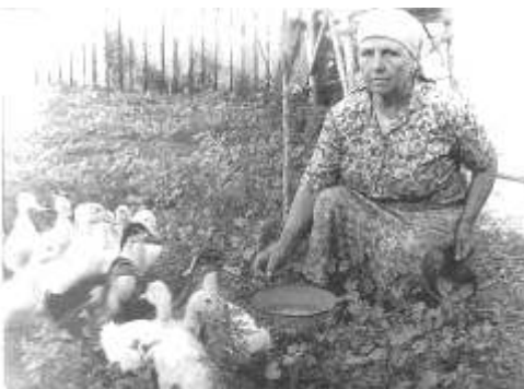
Mama Floarea a avut 6 pui de om si mai multi boboci