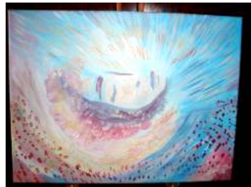
MI-E SUFLETUL ÎN AȘTEPTARE

Înțelegerea să-mi strălucească-n privire precum polii Pământului strălucesc în Iubire Coloana să mi-o-ncingă Iubirea ca brăuri brațele mele să curgă în râuri iar faptele mele, fără aripi sau șine s-ajungă-n Marea Compașunii divine.