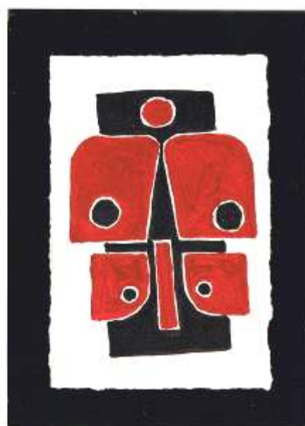
SAI - Frunza si Flutur