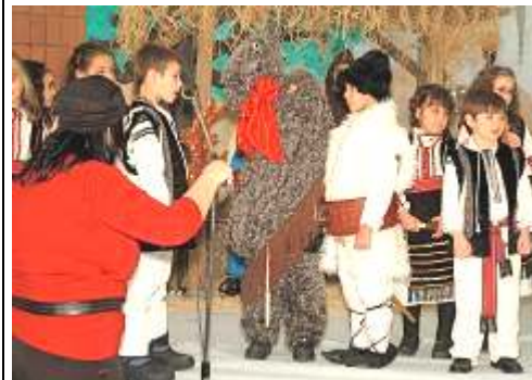
Colindul cu Capra

Mulumim lui Dumnezeu pentru tot ce face pentru noi, pentru biserică și comunitatea noastră. Totodată mulțumim părinților și profesorilor pentru osteneala lor și invităm toți copiii să participe la cursurile Scolii noastre. Împreună vom descoperi tainele sfinte noastre credințe ortodoxe și tradițiile noastre românești. În fiecare duminică, de la ora 11.00 până la ora 12.00, Școala Duminicală va aștepta.