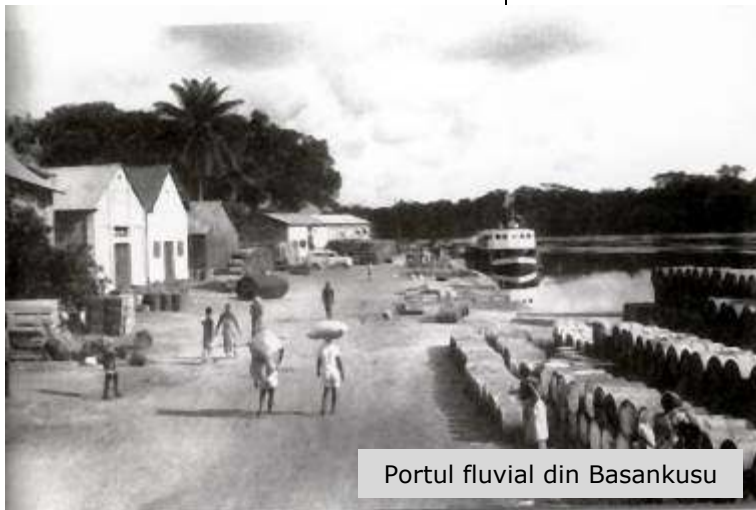
Portul fluvial din Basankusu