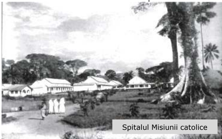
Spitalul Misiunii catolice

În timpul mesei am urmărit spectacolul oferit de tineri dansatori, băieți și fete. Erau însoțiți de o orchestră de șase voinici cu țimbale, fluiere, marakas-uri și un xilofon din tărtăcuțe de dovleci. Tam-tam-urile s-au oprit și aceștia au început o melopee africană la care s-au alăturat mai apoi, în surdină, și tam-tam-urile. Dansatorii, cu clopoței la picioare și pe brațe, au început să se învârtă în grupuri. Agitau brațele, zvâcneau din picioare și se balansau în ritmul muzicii, care se accelera din ce în ce mai tare. Tot satul, cu mic cu mare, asista la spectacol aliniat de-a lungul curții. În ritmul sacadat al tam-tam-urilor, spectatorii băteau pământul cu picioarele și acompaniau totul prin mișcări ale brațelor deasupra capului. Astfel antrenanți, timpul a zburat ca o clipă.