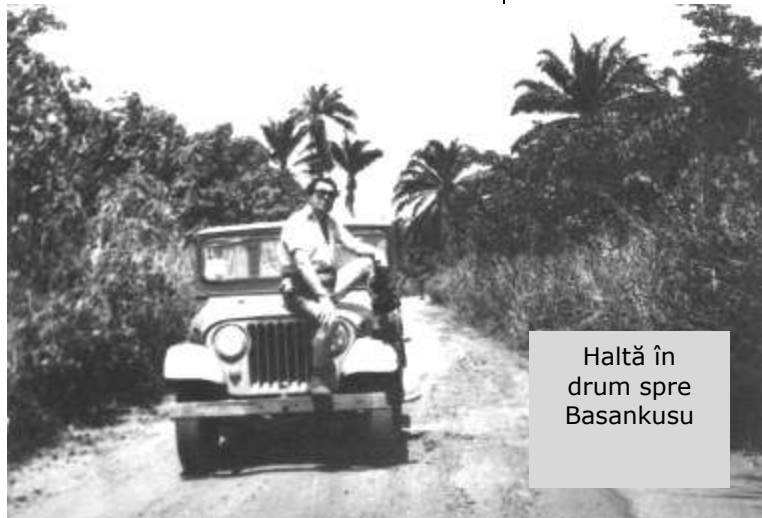
Haltă în drum spre Basankusu