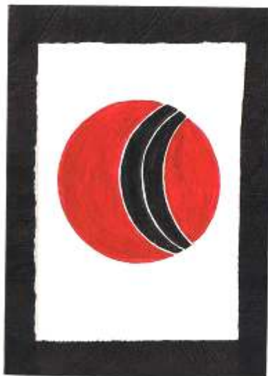
SAI - Soarele si Luna

Daca cineva din copiii mei, ori nepoții mei, se vor arăta interesați să citească cele ce am scris si vor considera ca le este de folos, voi avea satisfacția că am putut fi si eu cu ceva de folos .