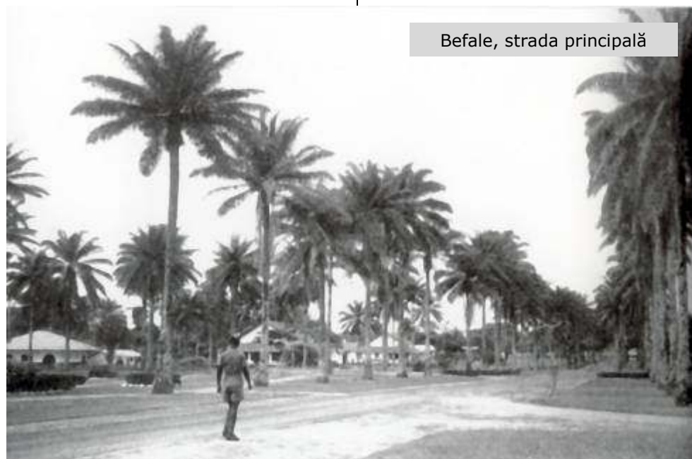
Befale, strada principală