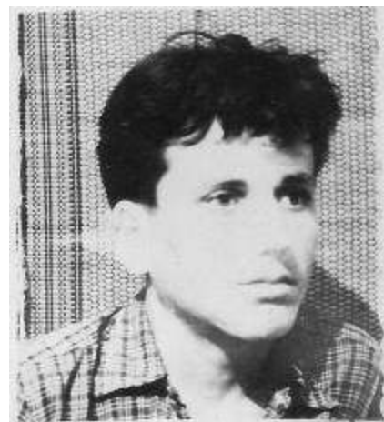
totusi,am avut si 15 ani...