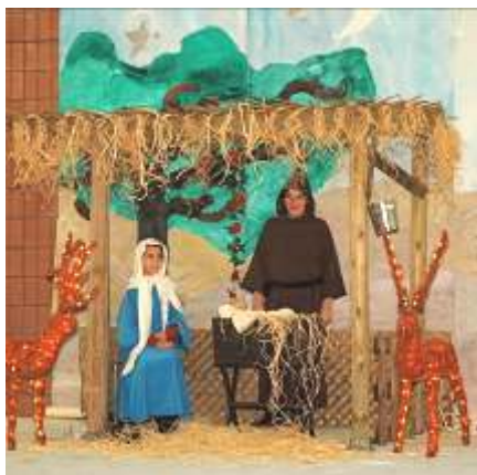
Sceneta de Craciun

In partea a treia, copiii au continuat cu colinde românești tradiționale, dar și colinde în limbile engleză și franceză (« Les anges dans nos campagnes », « Jingle Bells »... ). Și în acest an Mos Craciun a venit încărcat cu daruri multe . Ajutat de doamnele din Asociația Doamnelor, Mosul a împartit cadouri și a promis că va veni și la anul.