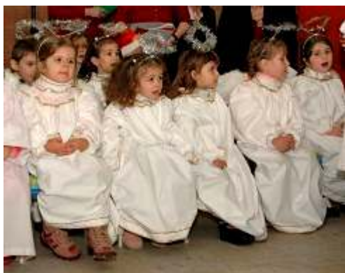
Sceneta de Craciun