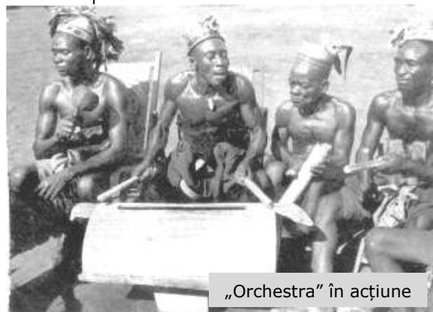
„Orchestra” în acțiune