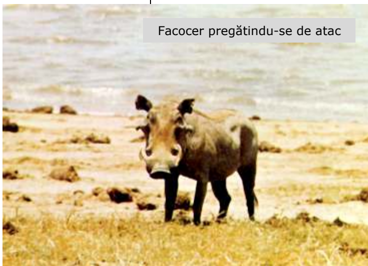
Facocer pregătindu-se de atac

Dimineața, ne-am despărțit emoționați și am pornit-o pe serpentinele care duceau către Waka și, în continuare, către Befale. Cei 150 de km i-am parcurs în puțin peste două ore.