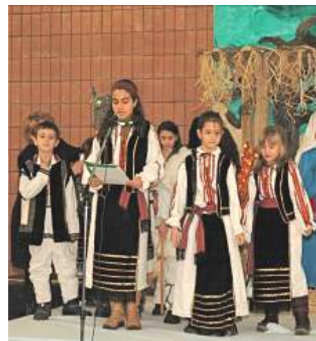
"Rugaciune" de M. Eminescu

In partea a doua a serbarii copiii au prezentat « Capra », « Steaua » si « Plugusorul ». Si aici, copiii au imbracat costume nationale romanesti si accesorii specifice acestor traditii .