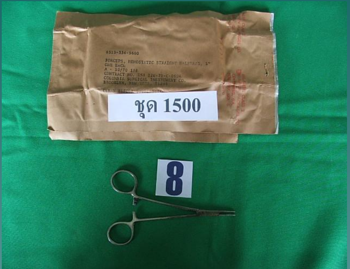
8. 6515-334-5600 Forceps Hemostatic Straight Halsted 5 ” ( กีมจับเส้นเลือดตรง )