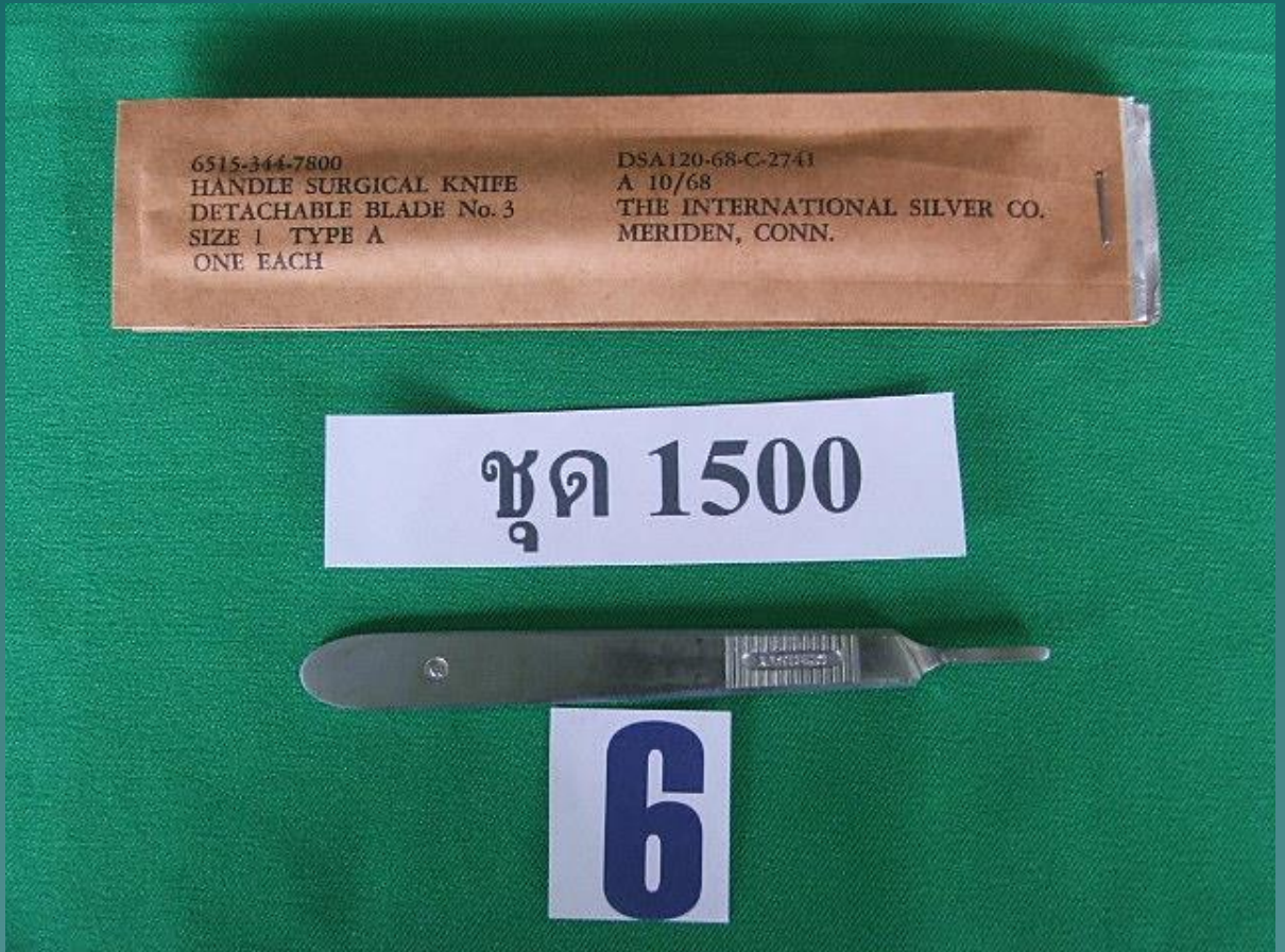
6. 6515-344-7800 Handle Surgical Knife Detachable Blade No.3 ( ด้ามมีดผ่าตัด เบอร์ 3 )