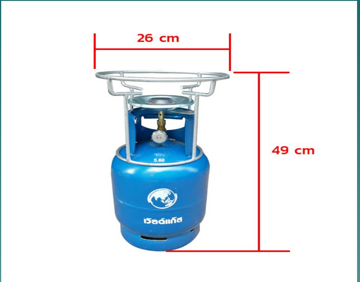
39. เตาแก๊สปิกนิก (ขนาดเล็ก)