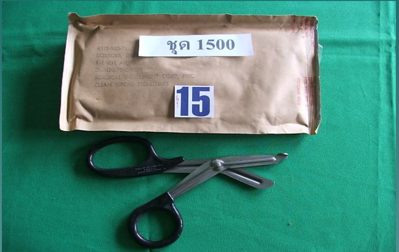
15. 6515-935-7138 Scissors Bandage Angular 7 ¼ ” ( กรรไกรตัดก๊อส )