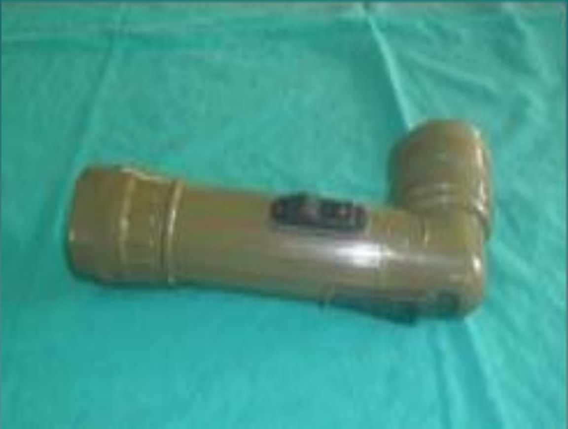
16. - Examination Flashlight ( ไฟฉาย ) สิ่งอุปกรณ์ขนาดเล็กน กคพ.พบ.ไม่มีจ่าย