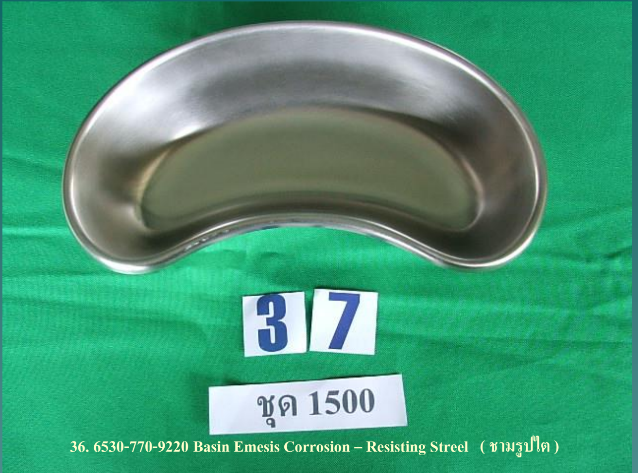
36. 6530-770-9220 Basin Emesis Corrosion – Resisting Steel (ชามรูปไต)