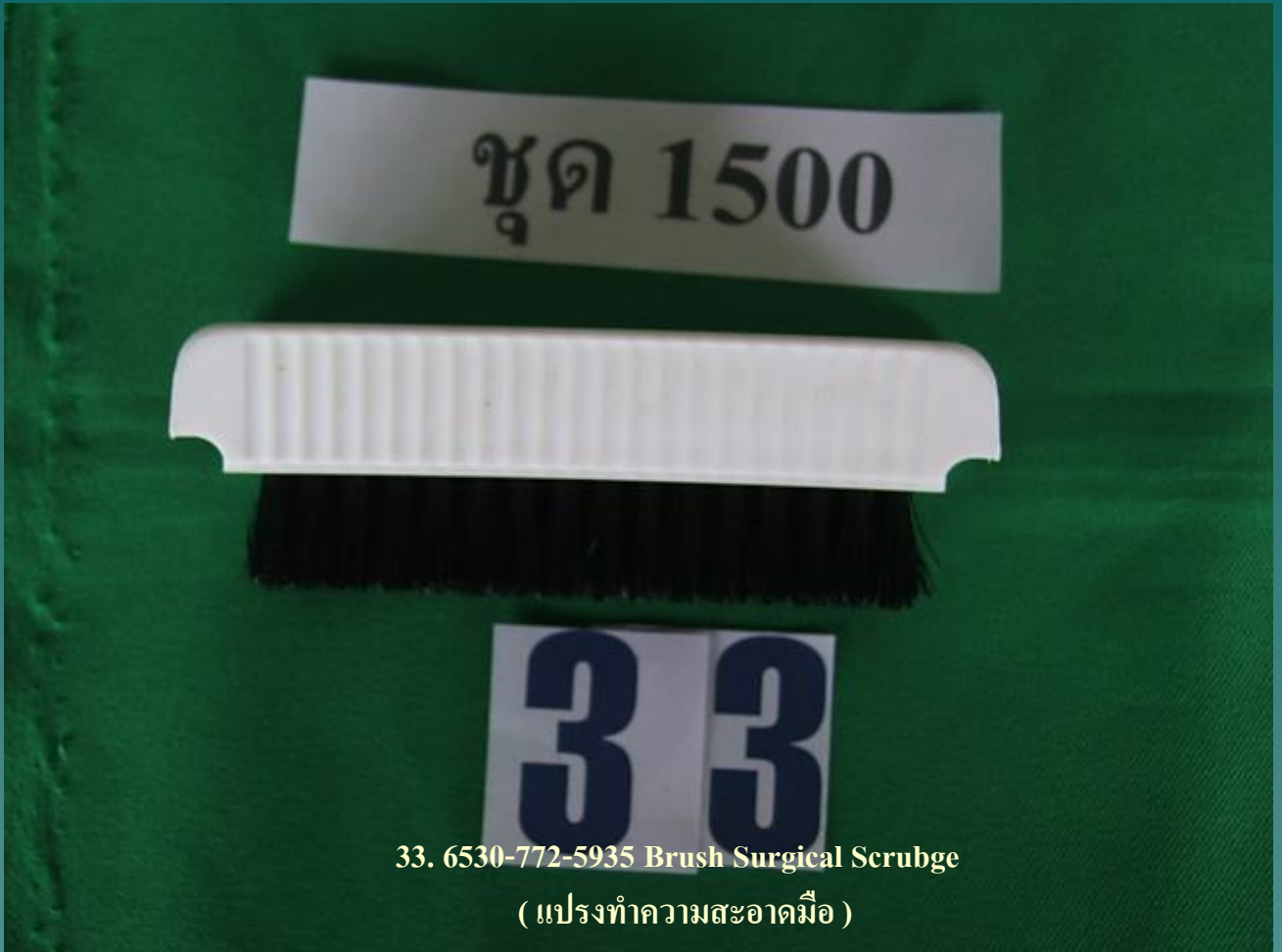
33. 6530-772-5935 Brush Surgical Scrubge (แปรงทำความสะอาดมือ)