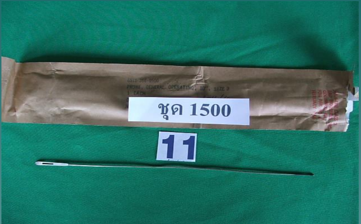
11. 6515-356-9500 Probe General Operating 10" ( หมุดหยั่งแผล )