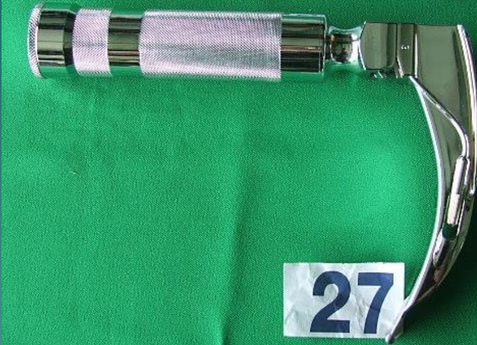
27. Laryngoscope พร้อม Curred Blade No.3 ( ชุดใส่ท่อช่วยหายใจ พร้อม Blade เบอร์ 3 )