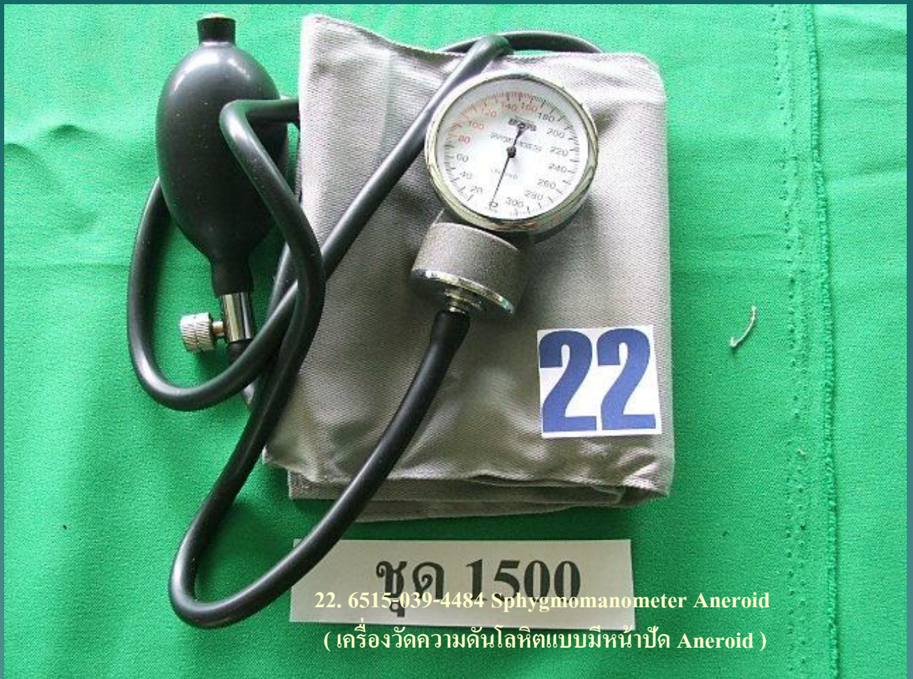
22. 6515-039-4484 Sphygmomanometer Aneroid ( เครื่องวัดความดันโลหิตแบบมีหน้าปัด Aneroid )