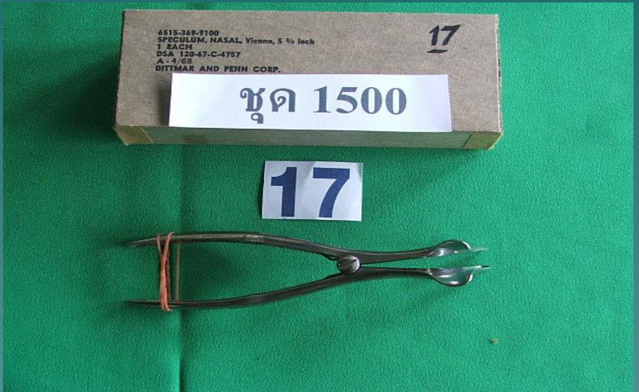
17. 6515-369-9100 Speculum Nasal Vienna 5 3/4” ( คีมต่างจมูก )