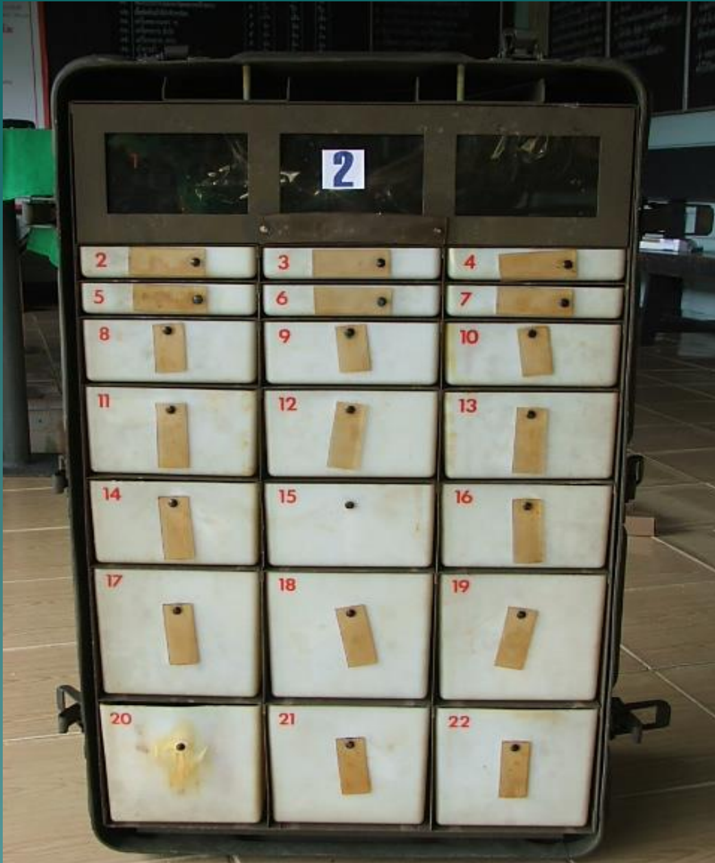
2. 6545-299-8649 Insert Cabinet Medical Instrument And Supply Set Chest ( ลังชั้นใน มีลิ้นชัก )