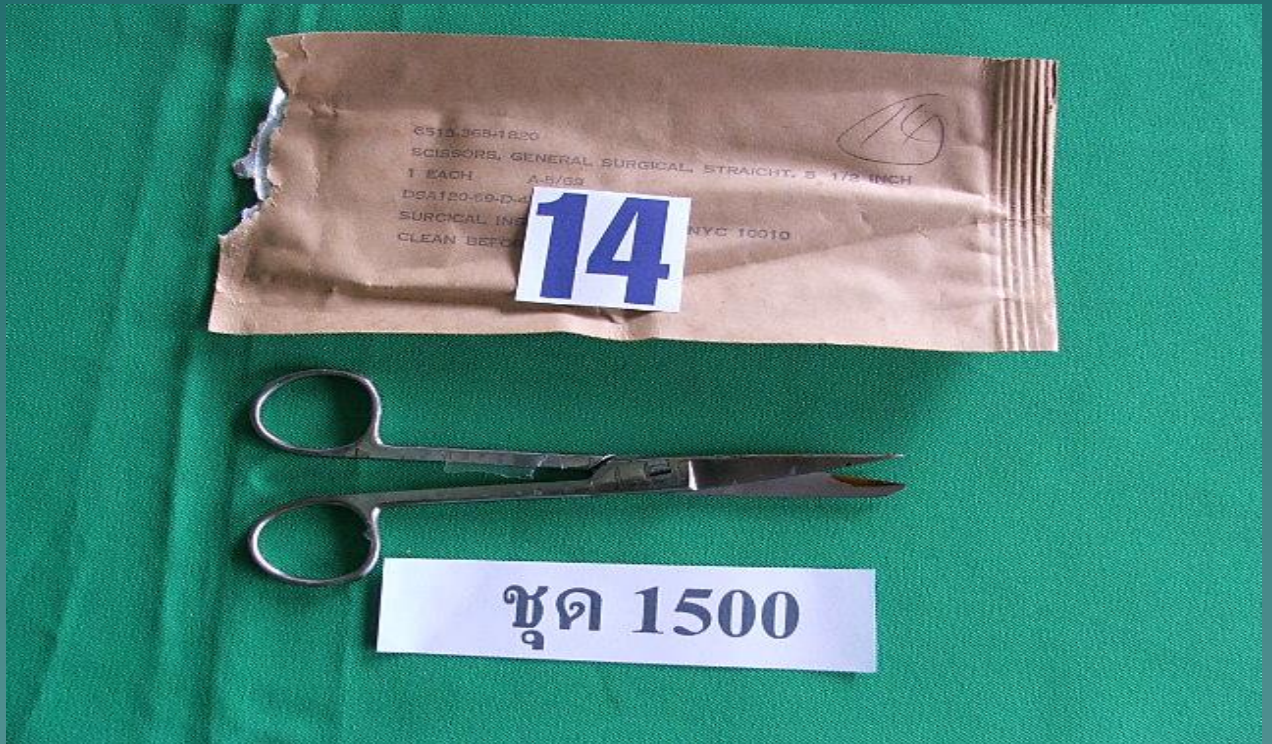
14. 6515-365-1820 Scissors General Surgical Straight 5 ½ ” ( กรรไกรตรง )