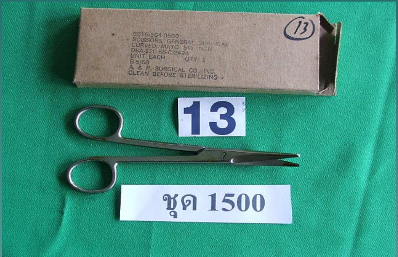
13. 6515-364-0500 Scissors General Surgical Curved Mayo 5 ½ ” ( กรรไกรโค้ง )