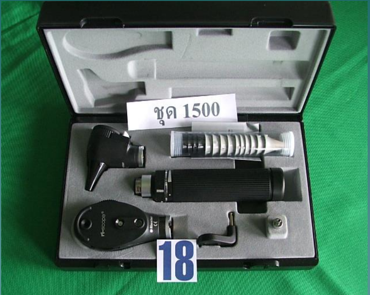
18. 6515-550-7199 Otoscope And ophthalmoscop Set Batter Type ( เครื่องตรวจหู คอ จมูก )