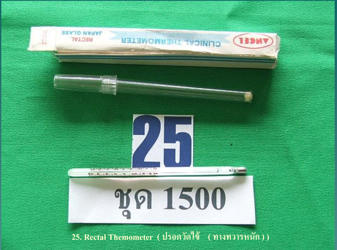
25. Rectal Themometer (ปรอดวัดไข้ (ทางทวารหนัก))