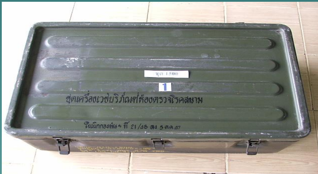
1. 6545-914-3500 CHEST Medical Instrument And Supply Set Field No.5 (ตั้งนอก)