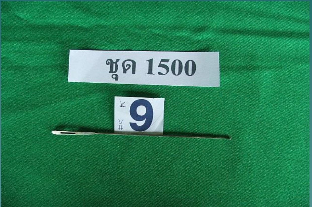
9. 6515-356-9100 Probe General Operating 5” ( หมุดหยั่งแปล )