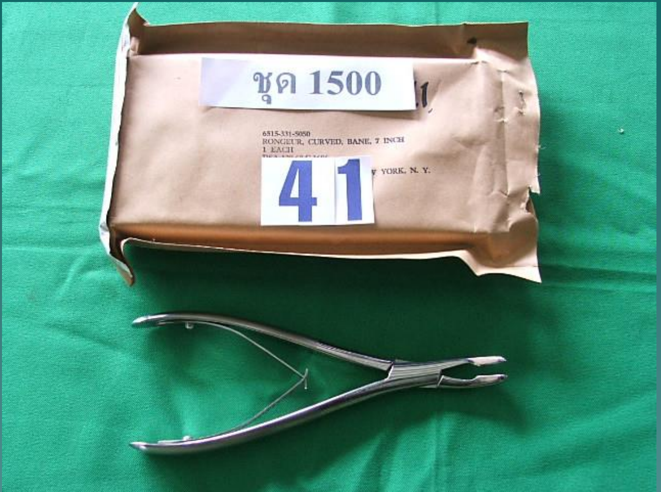
41. 6515-331-5050 Rongeur , Curved , Bane , 7 Inch