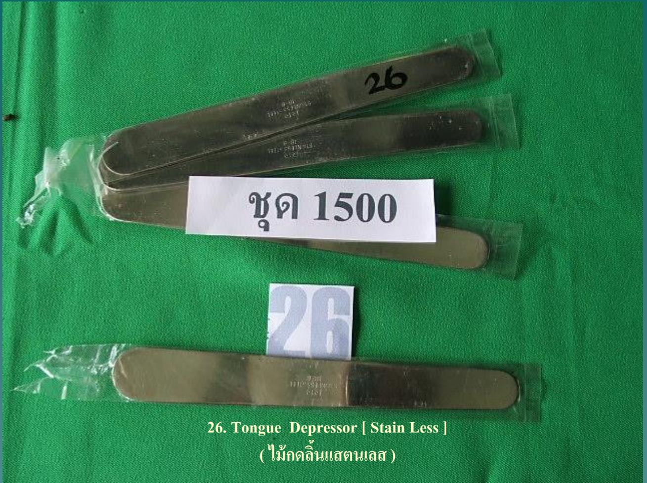
26. Tongue Depressor [ Stain Less ] ( ไม้กดลิ้นสแตนเลส )