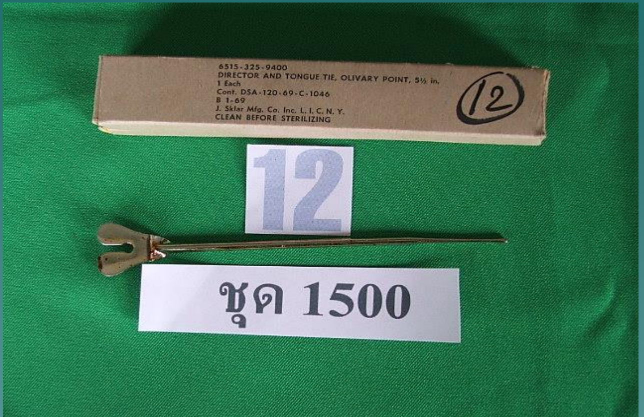
12. 6515-325-9400 Director And Tonguetie ,Olivary Point 5 ½ ” (หมุดหยั่งแผล )