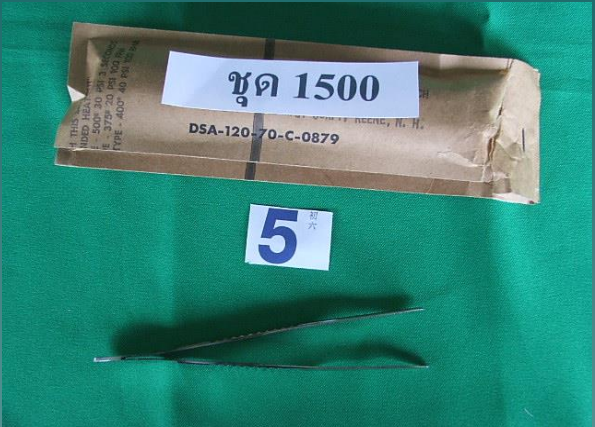
5. 6515-333-3600 Forceps Dressing Straight 5 ½ ” ( คีบทำแผลตรง )