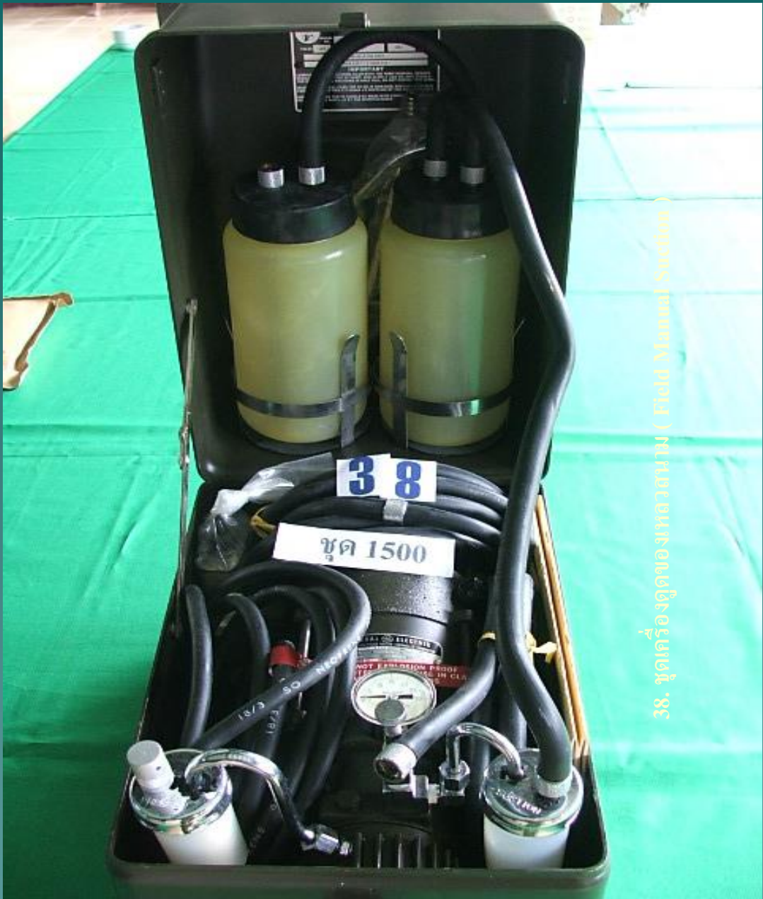
38. ชุดเครื่องดูดของเหลวสนาม ( Field Manual Suction )