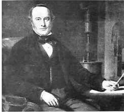
James Prescott Joule

Crise de l'énergie, coût de l'énergie, économies d'énergie, nouvelles sources d'énergie.... nos bouches sont pleines du mot « énergie ». Pourtant ce mot dans son acception scientifique actuelle n'a guère plus de 150 ans et l'on doit sa première apparition à l'ingénieur écossais William Rankine.