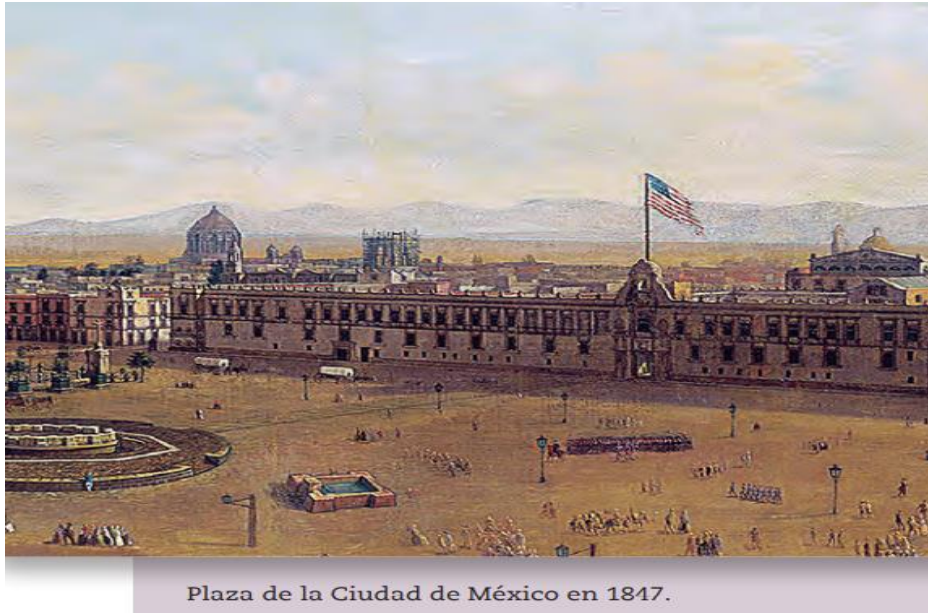
Plaza de la Ciudad de México en 1847.

Observa la siguiente imagen y describe que es lo que está sucediendo en la Ciudad de México.