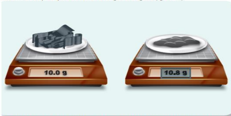
Figura 1.40 La diferencia en las lecturas de la báscula se debe a que, en la combustión, el magnesio se combinó con oxígeno resultando en

Esta actividad se encuentra en la página 55 de tu libro