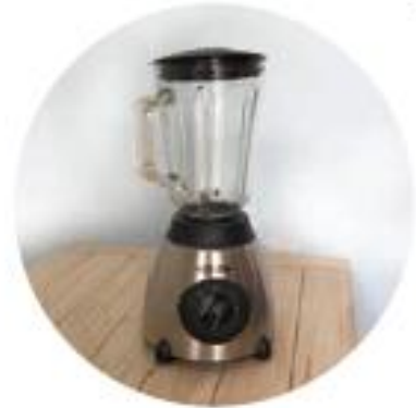
Figura 2.83 Tecnología utilizada en el hogar. La licuadora ha sustituido al mortero o molcajete para moler alimentos.

Sin embargo, algunas de estas actividades son tan cotidianas, que no es posible percatarse del proceso histórico que llevó a su desarrollo y establecimiento.