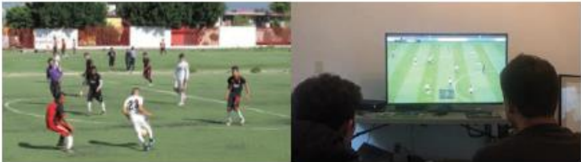
Figura 2.84 La tecnología cambia y es parte de nuestra vida, con o sin componentes electrónicos.