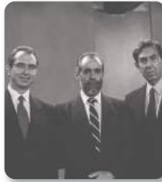
Figura 3.18 En 1994, se celebró el primer debate presidencial en México. En la imagen, los candidatos Ernesto Zedillo, Diego Fernández de Ceballos y Cuauhtémoc Cárdenas. Debate electoral (1994).

En las elecciones presidenciales del año 2000, el PRI postuló a Francisco Labastida; el Partido de la Revolución Democrática (PRD), al entonces jefe de gobierno del Distrito Federal, Cuauhtémoc Cárdenas, y el PAN, a Vicente Fox, quien resultó vencedor. Con estos comicios terminaron setenta años de gobierno del partido hegemónico. Por primera vez en su historia, el PRI perdía la presidencia de la República.