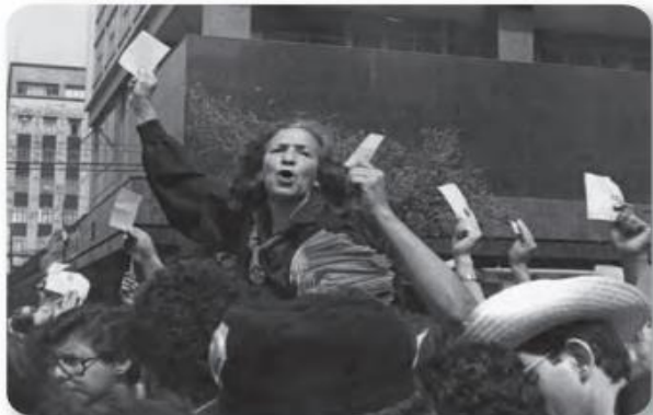
Figura 3.16 Con una destacada trayectoria como luchadora social a favor de los desaparecidos y víctimas de la guerra sucia, Rosario Ibarra fue la primera candidata a la presidencia de la República en 1982 por el PRT. Participación de Rosario Ibarra en una manifestación rumbo al Zócalo Capitalino (1989).

La LOPPE permitió la formación de nuevos partidos políticos. A partir de 1982, además de los que ya existían como el PRI, el PAN, el Partido Auténtico de la Revolución Mexicana (PARM) y el Partido Popular Socialista (PPS), se registraron, entre otros, el Partido Socialista Unificado de México (PSUM), el Partido Demócrata Mexicano (PDM) y el Partido Revolucionario de los Trabajadores (PRT) (figura 3.16).