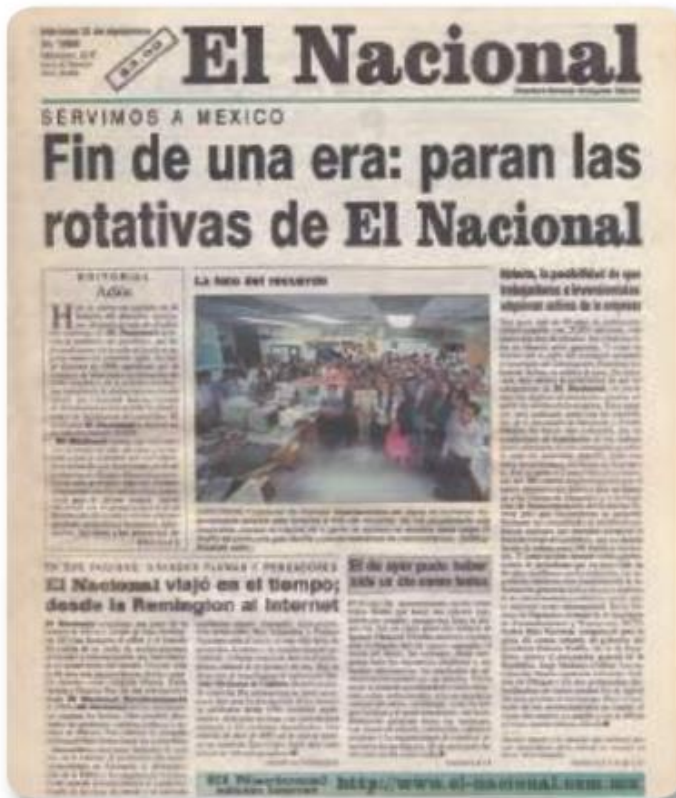
Figura 3.19 El Nacional fue el periódico oficial del gobierno mexicano, fundado en 1929. Dependía de la Secretaría de Gobernación. Portada de El Nacional , miércoles 30 de septiembre de 1998.