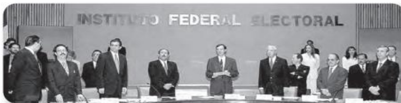
Figura 3.17 Cuando José Woldenberg presidió el IFE, se organizaron las elecciones de 1997 y 2000. Sesión permanente del IFE (2000).

En 1990, la ley electoral fue reformada y se creó el IFE, el cual se mantuvo bajo el control de la Secretaría de Gobernación hasta 1996, cuando se modificó la ley para que fuera dirigido por un consejo ciudadano designado por el Senado (figura 3.17). Por primera vez, el órgano electoral era autónomo del gobierno. En el 2014 se realizó una reforma para transformar al IFE en una autoridad nacional: el Instituto Nacional Electoral (INE).