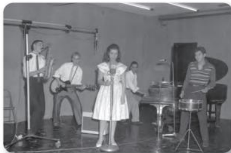
Figura 3.31 El rock and roll se popularizó en México en la década de 1960 por influencia directa de los grupos de Estados Unidos. Grupo de Rock and Roll durante la grabación de un disco (ca. 1960).