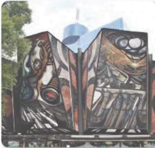
Figura 3.29 En México, los murales se convirtieron en arte público. En los años de 1960, Siqueiros decoró doce grandes paneles en el Polyforum Cultural Siqueiros. Vista

En la década de 1940, continuaron destacando artistas como José Clemente Orozco, Diego Rivera y David Alfaro Siqueiros, por mencionar algunos. Entre los muchos temas de sus obras sobresalen la cultura popular mexicana, las luchas sociales y la diversidad cultural de nuestro país.