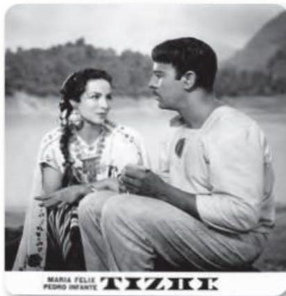
Figura 3.33 Por su interpretación en la película Tizoc , en 1956, Pedro Infante ganó el Oso de Plata al mejor actor del Festival Internacional de Cine de Berlín de 1957. En abril de ese año, murió en un accidente aéreo en Yucatán. María Félix con Pedro Infante en Tizoc (1957).