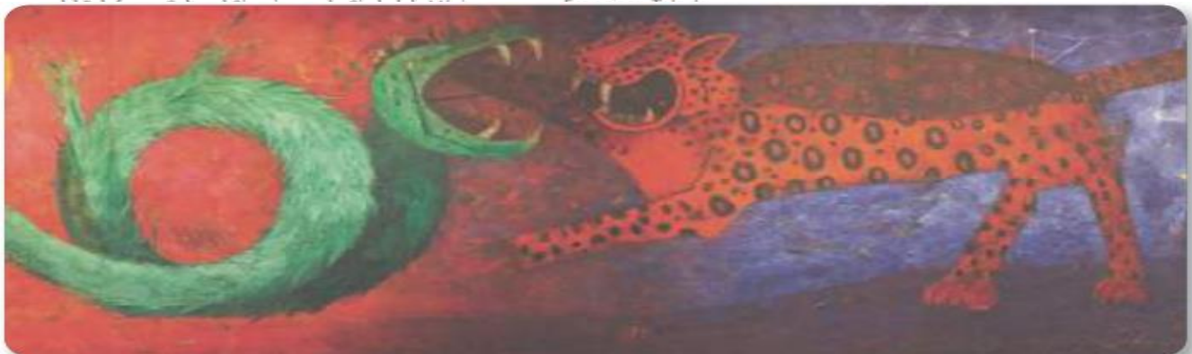
Figura 3.30 En este mural, Rufino Tamayo muestra parte de la cosmogonía prehispánica al representar la lucha entre Quetzalcóatl (la serpiente emplumada, símbolo del día) y Tezcatlipoca (simbolizado por el jaguar y la noche). Dualidad, Rufino Tamayo (1964).

Sin embargo, desde los años cincuenta, algunos artistas desearon desarrollar formas de expresión más personales. A esta nueva ola de artistas se le llamó generación de la ruptura , la cual tuvo a Rufino Tamayo y a José Luis Cuevas como sus principales representantes. Tamayo expresó la herencia mexicana en piezas vibrantes llenas de colorido (figura 3.30), mientras que Cuevas fue un dibujante y escultor cuyos temas incluían seres deformes. Otros artistas del periodo fueron Juan Soriano, Rafael Coronel y