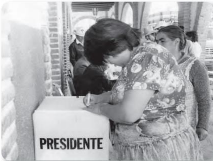
Figura 3.2 La participación ciudadana es fundamental en un sistema democrático. En México, el abstencionismo (práctica que consiste en no ejercer el derecho al voto por voluntad propia) fue superior a 24% en las elecciones presidenciales entre 1964 y 2000. Elecciones en México, casillas electorales (1988).