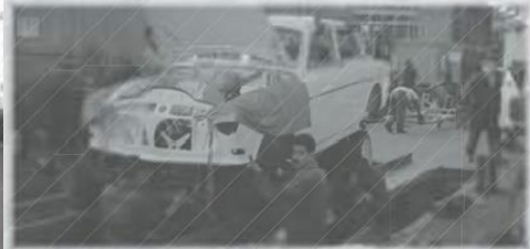
Obreros ensamblando un automóvil en la planta automotriz de la Volvo (ca. 1962).

2 En las décadas de 1950 y 1960, se aplicó en México una política de desarrollo estabilizador que impulsó la industrialización del país al proteger a las empresas de la competencia con el exterior. La inflación fue baja y el tipo de cambio se mantuvo en 12.50 pesos por dólar de 1954 a 1970. La economía mexicana creció de forma sostenida, por lo que a este periodo se le conoce como milagro mexicano .