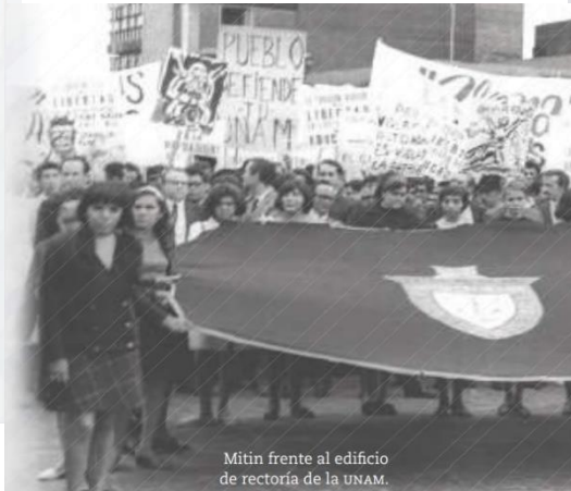
Mitín frente al edificio de rectoría de la UNAM.

2 En las décadas de 1950 y 1960, se aplicó en México una política de desarrollo estabilizador que impulsó la industrialización del país al proteger a las empresas de la competencia con el exterior. La inflación fue baja y el tipo de cambio se mantuvo en 12.50 pesos por dólar de 1954 a 1970. La economía mexicana creció de forma sostenida, por lo que a este periodo se le conoce como milagro mexicano .