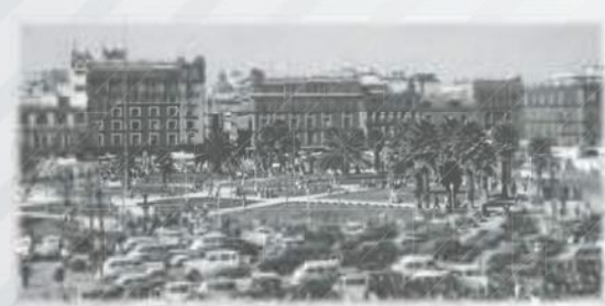
Automóviles estacionados en el Zócalo (ca. 1950).

1 Durante los años cuarenta, la economía mexicana, en particular el sector industrial, se vio impulsada por la demanda de productos de Estados Unidos, cuya economía estaba concentrada en el esfuerzo bélico de la Segunda Guerra Mundial. La tasa de crecimiento de la población mexicana aumentó.