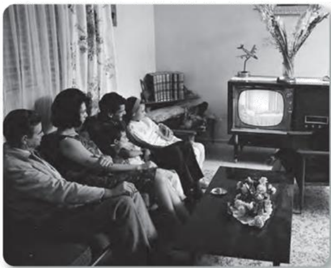
Figura 3.27 La televisión fue uno de los medios de entretenimiento e información más populares para la sociedad mexicana en la segunda mitad del siglo xx. Familia observa un programa de televisión (1960).

Las ciudades crecían y se abrieron avenidas para el tránsito de automóviles y transporte público; por ejemplo, en 1969, se inauguró la primera línea del metro de la Ciudad de México. También se expandieron las autopistas y los aeropuertos. Desde los años cincuenta, la televisión empezó a competir con la radio como fuente de entretenimiento e información (figura 3.27). Los deportes profesionales atraían cada vez más público. Entre los años cincuenta y sesenta, los supermercados fueron expandiéndose y modificaron la forma de comprar de muchas familias. Además, paulatinamente se fue popularizando el uso de los aparatos electrodomésticos, como los refrigeradores y las lavadoras, los cuales impactaron en el estilo de vida de las familias. A finales del siglo xx, el uso de computadoras y el internet revolucionó la forma de trabajar y comunicarse.