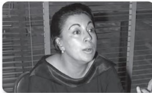
Figura 3.28 Rosario Castellanos brindó en su obra una visión de temas poco abordados en la literatura mexicana, como la condición de la mujer. Rosario Castellanos conversa sentada tras un escritorio (ca. 1965).

En cuanto al teatro, hubo experimentación constante en dramaturgos como Emilio Carballido ( La danza que sueña la tortuga , de 1955) y Víctor Hugo Rascón Banda ( Tina Modotti , de 1981). Por otro lado, Salvador Novo y Carlos Monsiváis destacaron como periodistas y cronistas culturales.