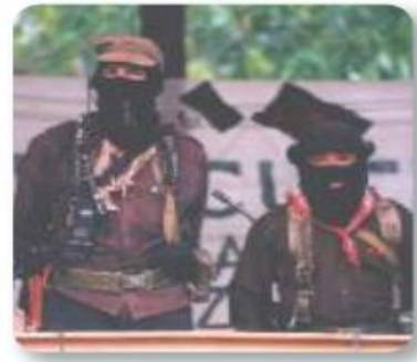
Figura 3.24 El líder visible del alzamiento zapatista y vocero del movimiento ha sido el subcomandante Marcos, hoy Galeano. Marcos y Tacho durante el encuentro del EZLN con la Sociedad Civil, La Realidad, Chiapas (1999).

Como ese año había elecciones presidenciales, el gobierno detuvo las hostilidades y estableció una tregua con el EZLN. En 1995, el gobierno intentó reprimir de nuevo, pero finalmente ambos bandos firmaron los Acuerdos de San Andrés Larráinzar, que, entre otros puntos, conceden la autonomía a las comunidades indígenas. Este acuerdo no fue puesto en práctica, aunque en 2001 el Congreso reformó el artículo 2º constitucional para reconocer a las comunidades indígenas el derecho al autogobierno.