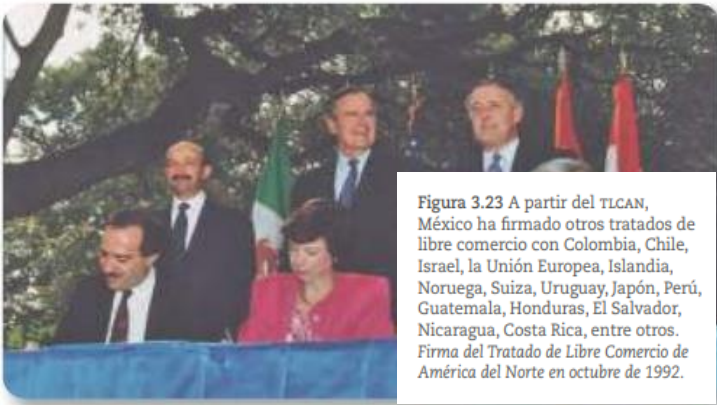
Figura 3.23 A partir del TLCAN, México ha firmado otros tratados de libre comercio con Colombia, Chile, Israel, la Unión Europea, Islandia, Noruega, Suiza, Uruguay, Japón, Perú, Guatemala, Honduras, El Salvador, Nicaragua, Costa Rica, entre otros. Firma del Tratado de Libre Comercio de América del Norte en octubre de 1992.

La apertura comercial se profundizó en 1992 con la firma del Tratado de Libre Comercio de América del Norte (TLCAN) con Estados Unidos y Canadá, el cual entró en vigor el 1 de enero de 1994 (figura 3.23).