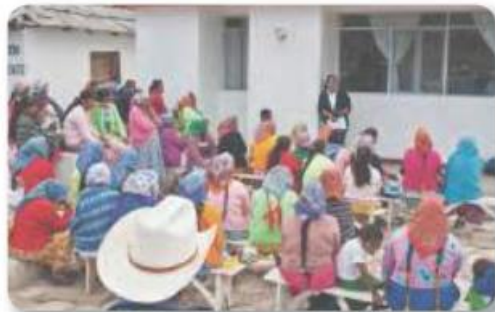
Figura 3.25 Desde la década de los noventa, aumentó la infraestructura médica, pero la atención para todos aún es un reto. Clínica Churo, Chihuahua.

Los problemas económicos que México padeció durante los años ochenta y los noventa impactaron en sectores como el de la salud. Si bien se trató de mantener la inversión en hospitales y clínicas, tanto el IMSS como el ISSSTE se vieron presionados por la falta de recursos y el aumento de la demanda de servicios por parte de la población. Se logró aumentar la esperanza de vida en cuatro años más y se redujo la tasa de mortalidad. Las principales causas de muerte durante este periodo fueron las enfermedades del corazón, los tumores malignos, la diabetes y los accidentes.