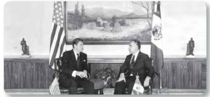
Figura 3.21 Los cambios en la política interna en México fueron de la mano de un acercamiento a las políticas de Estados Unidos durante los tiempos de la administración de Ronald Reagan (1981-1989). Visita del presidente de los Estados Unidos, Ronald Reagan, con el presidente de los Estados Unidos Mexicanos Miguel de la Madrid (1986).