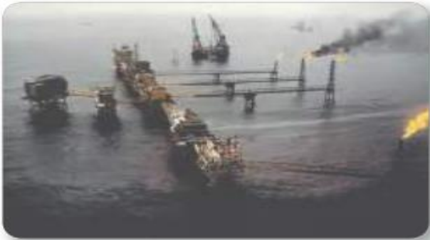
Figura 3.20 El complejo de Cantarell en la sonda de Campeche, en las aguas del golfo de México, es un conjunto de plataformas de extracción de petróleo. Actualmente, sólo produce 82000 barriles diarios. Plataforma petrolera.

Por otro lado, se comenzaron a tener problemas inflacionarios, es decir, un aumento generalizado en los precios de los productos. Además, dentro de la economía siguió disminuyendo la importancia del sector primario (agricultura, ganadería, silvicultura y pesca), el cual pasó de representar 17% del PIB entre 1951 y 1962, a 8.75% entre 1977 y 1981. Por último, el sector externo también tenía problemas, pues durante la primera mitad de la década de 1970, México cada vez compraba más cosas del exterior y vendía menos.