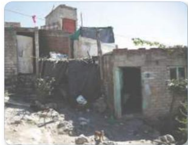
Figura 3.35 Una persona está en situación de pobreza extrema por ingresos cuando sus recursos no le alcanzan para comprar los productos de la canasta básica alimentaria. El barrio, Jalisco, México.

De los hogares pobres sostenidos sólo por mujeres, 38% carece de acceso a una alimentación de calidad. En México, las mujeres siguen padeciendo desigualdad en el acceso a educación, salud, trabajo y nutrición digna.