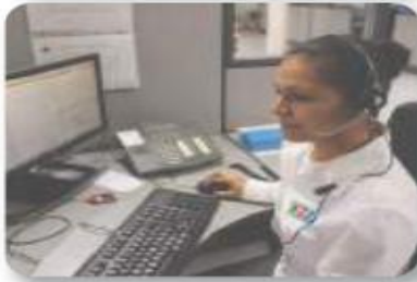
Figura 3.36 Si bien las mujeres actúan en el mercado laboral, la mayoría de ellas se sigue encargando del trabajo doméstico y la atención de la familia, responsabilidades que no son asumidas igualmente por la mayor parte de los hombres.