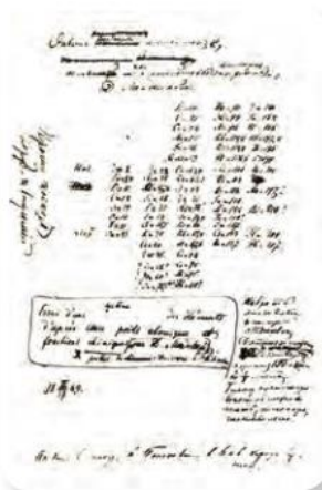
Figura 2.40 Borrador manuscrito de Mendeléiev en donde se aprecian filas, columnas y huecos para organizar a los elementos.

El químico ruso Dmitri Mendeléiev (1834-1907) propuso en 1869 una clasificación de los elementos con base en sus pesos atómicos y otras propiedades (figura 2.40). Pensó que si agrupaba los elementos de acuerdo con las regularidades de sus propiedades, se le facilitaría exponer su cátedra a los estudiantes. Elaboró tarjetas con información de los elementos conocidos y las ordenó en grupos con propiedades similares. Si una tendencia no se cumplía, argumentaba que se debía a que faltaba un elemento no descubierto aún. Su explicación fue altamente predictiva: reservó esos “huecos” a elementos faltantes, como el galio y el germanio, que efectivamente se descubrieron poco después.