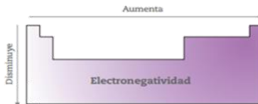
Figura 2.49 Tendencia de la electronegatividad.

La electronegatividad es la facilidad con la que un átomo retiene el par de electrones del enlace químico formado cuando se une a otro. Esta propiedad aumenta de izquierda a derecha en los periodos y disminuye de arriba hacia abajo en los grupos de la tabla periódica (figura 2.49). Un elemento muy electronegativo tendrá afinidad electrónica y energía de ionización alta, es decir, atraerá con facilidad electrones de otros átomos y, difícilmente, perderá los suyos.