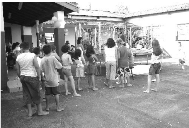
Fila para brincar na cama elástica