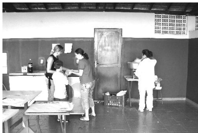
Entrega de sorvete e algodão doce