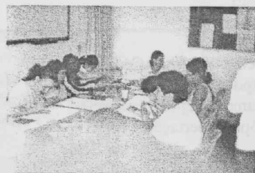
PINTURA EM TECIDOS