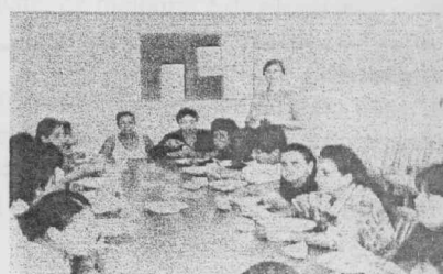
APÓS O PÃO DO ESPÍRITO : A SOPA