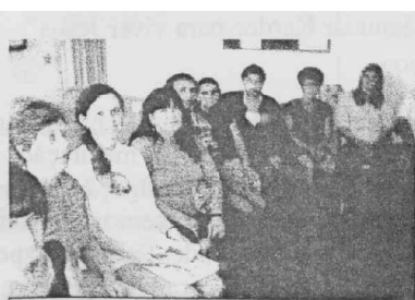
EVANGELHO PARA ADULTOS

Os nossos sinceros agradecimentos a todos que, de uma maneira ou de outra, colaboraram para mais esta realização.