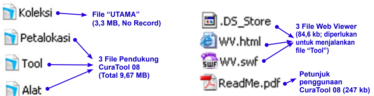
Gambar 2.: Delapan File Utama, perhatikan ICON FILE-nya.

Ada 8 (delapan) file dari 47 file diatas yang harus diselalu dijaga, yaitu: File Koleksi (untuk menyimpan semua data), File Petalokasi (untuk menunjukkan tata letak koleksi), File Tool (untuk mengetahui tentang gambaran studi koleksi), File Alat (untuk mengetahui tentang alat dan tabel pendukung operasional museum), 3 File Web Viewer (diperlukan untuk menjalankan File Tool), dan File Read Me (petunjuk penggunaan CuraTool 08). Perhatikan Gambar 2 dibawah.