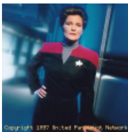
Capitã Kathryn Janeway