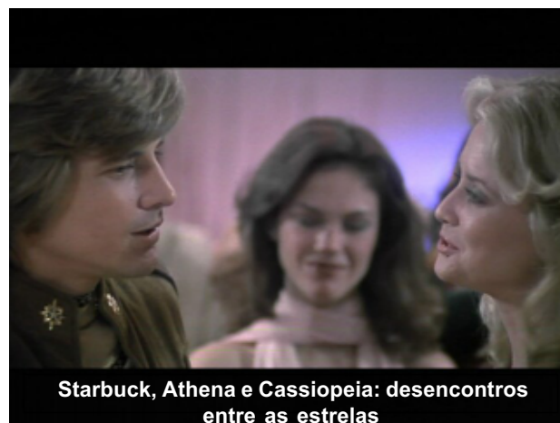
Starbuck, Athena e Cassiopeia: desencontros entre as estrelas

"Enterprise" não tem nada como isso. E sofre por esta falta. Emocionalmente, "Enterprise" é bidimensional. Não há nada lá em que você possa cravar os dentes. Por quê nos preocupamos com estes personagens? Devemos nos preocupar com estes personagens? Na verdade, não.