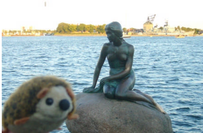
Willi Igel in Kopenhagen Die kleine "Nicht-Mehr-Jungfrau"