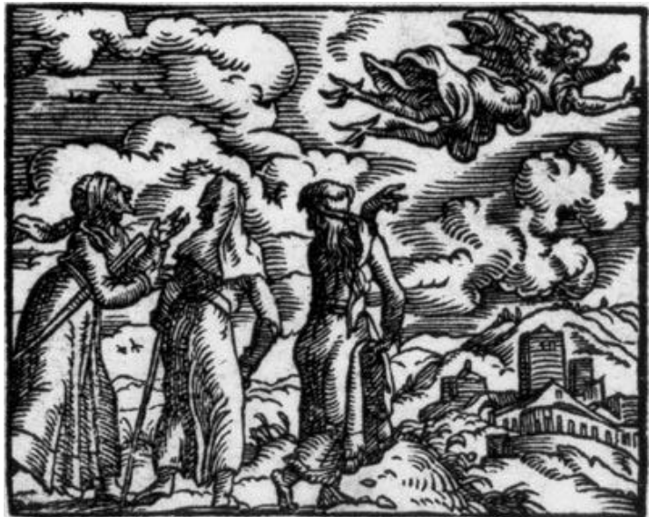
Hexenflug – Titelbild aus Johannes Weyer: "De praestigis daemonum", 1566

Im April 1701 fand das letzte Hexentribunal im Alten Zürich statt. Ein regelrechter Massenprozess: 32 Einwohner von Wasterkingen klagten gegen 13 ihrer Mitbürgerinnen und Mitbürger. Vorwurf: Ausübung von schwarzer Magie in Feld und Stall. Bilanz: 7 Frauen und 1 Mann wurden verurteilt, hingerichtet und verbrannt.