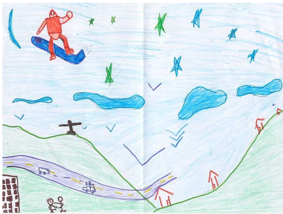
Desenho 1: Shinayder, oficina de imprensa escolar