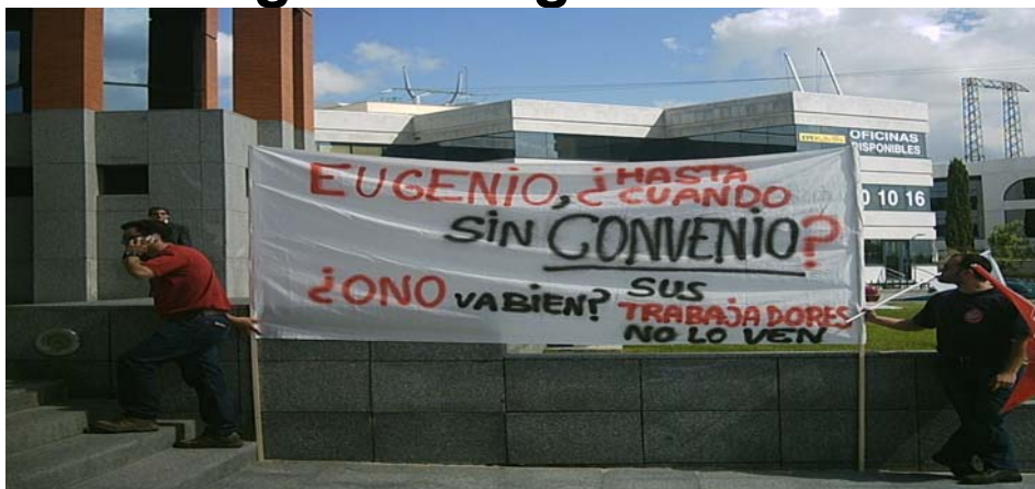
Pitada que precedió a la firma del convenio el pasado mes de mayo.

Tras la complicada negociación para la firma del II Convenio Colectivo del Cable, que significó un avance en las reivindicaciones de los trabajadores de ONO y los acuerdos del pasado 8 de Julio en materia de subida salarial, jornada intensiva, tickets de comida y aumento de la compensación por disponibilidad, UGT realizó una nueva propuesta de negociación que incluía aspectos como: