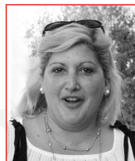
▶ Dolors Montilla Secr. de la Dona