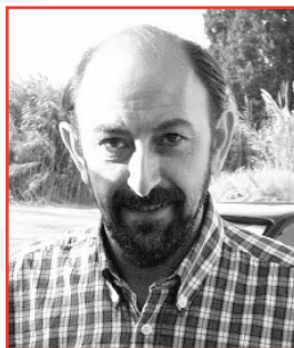
▶ Josep Borrell Secr. de Relacions Institucionals