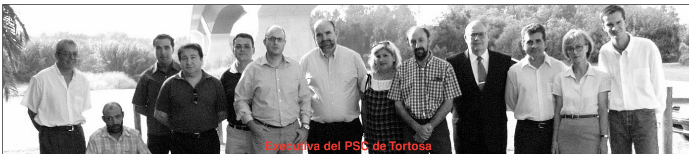
Executiva del PSC de Tortosa

El PSC de Tortosa treballa per a assolir el lloc que li pertoca a la nostra ciutat i apostem decididament per a buscar les complicitats necessàries que ens portaran al canvi polític i econòmic a les Terres de l'Ebre , amb la convicció ferma que les persones són el més important per a nosaltres.