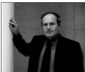
Josep Montilla, 1er Secretari PSC

El passat 25 d'abril, el partit dels Socialistes de Catalunya a les Terres de l'Ebre van constituir el consell de la Regió, format per 61 membres. És el màxim òrgan polític de la regió, entre congrés i congrés. L'acte de constitució va estar presidit pel primer secretari del PSC, Josep Montilla, el qual va assegurar que és molt positiu que el PSC tingui una organització pròpia a l'Ebre i demostra l'aposta del partit per a la regionalització de Catalunya. En referència a la problemàtica del PHN el dirigent socialista va assegurar que al PSC no li preocupa el cost electoral que pugui tenir CIU, si no el preu que pagaran les Terres de l'Ebre i Catalunya com a conseqüència del vassallatge de CIU al PP.