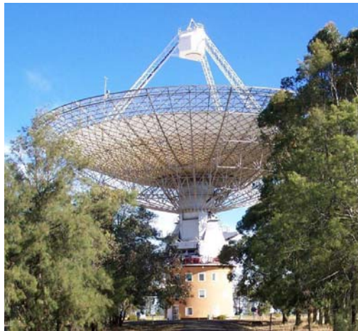
Figure 2: Antena de 64 metros de diametro. New Soth Wales, Australia.

Las causas física de esta particular geometría denominada “warp” aun no esta entendida, aunque no faltan las especulaciones. Una de ellas es que debido a la fricción interna del disco se produce un cambio en la rotación, causando que el material mas alejado incline el eje de rotación, apareciendo así un segundo eje de rotación para el material que se desvía del plano. Otra es la interacción gravitatoria de las galaxias con sus vecinas. En el caso de la Vía Láctea, la vecina mas cercana en la nube mayor de Magallanes, una galaxia mas pequeña satélite de la nuestra.