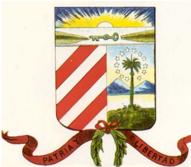
arriba: Escudo de Cuba usado por los movimientos anexionistas antes de 1868.

El Escudo Nacional fue creado en 1849 por Miguel Teurbe Tolón, después que este mismo había diseñado la bandera con la descripción de Narciso López. El escudo en su inicio, aportó elementos como el anexionismo, que mas tarde fueron suprimidos por no coordinar con las ideas independentistas del momento. Narciso López lo uso para sellar los despachos y bonos que como jefe de la primera insurrección, emitió entre los años 1850 y 1851.