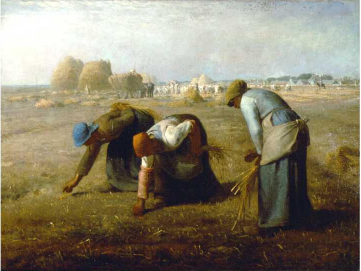
Jean-François Millet, Le spigolatrici, 1857, Musée d'Orsay, Parigi