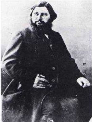
Nadar, Gustave Courbet, pittore di moderna sensibilità, rivoluzionario, partecipò alla Comune di Parigi, di cui fu delegato per le Belle Arti (1861).