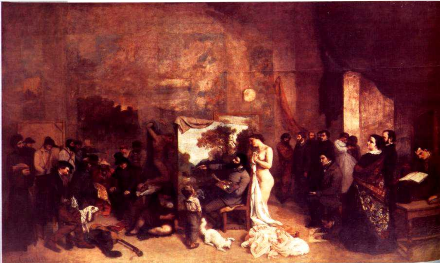
Lo studio dell'artista 1855

“Senza la rivoluzione del '48 forse non si sarebbe mai vista la mia pittura”