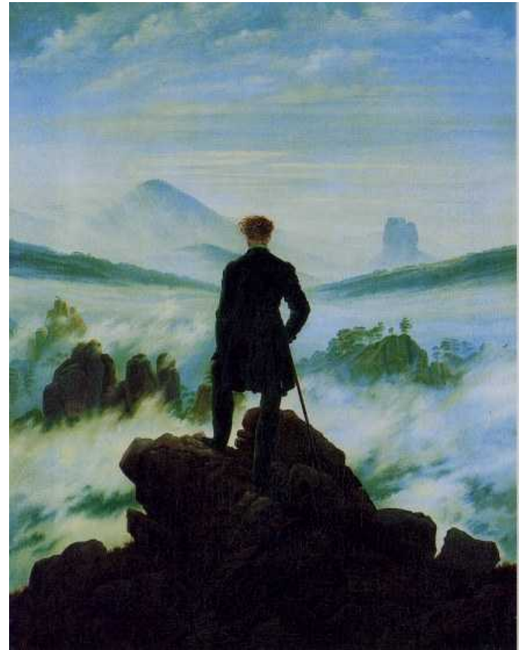
Viandante davanti a un mare di nebbia - 1818