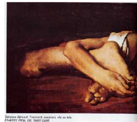
Detail of Géricault, 'The Raft of the Medusa', oil on canvas, 1819, Musée de la Ville de Paris, Paris, France