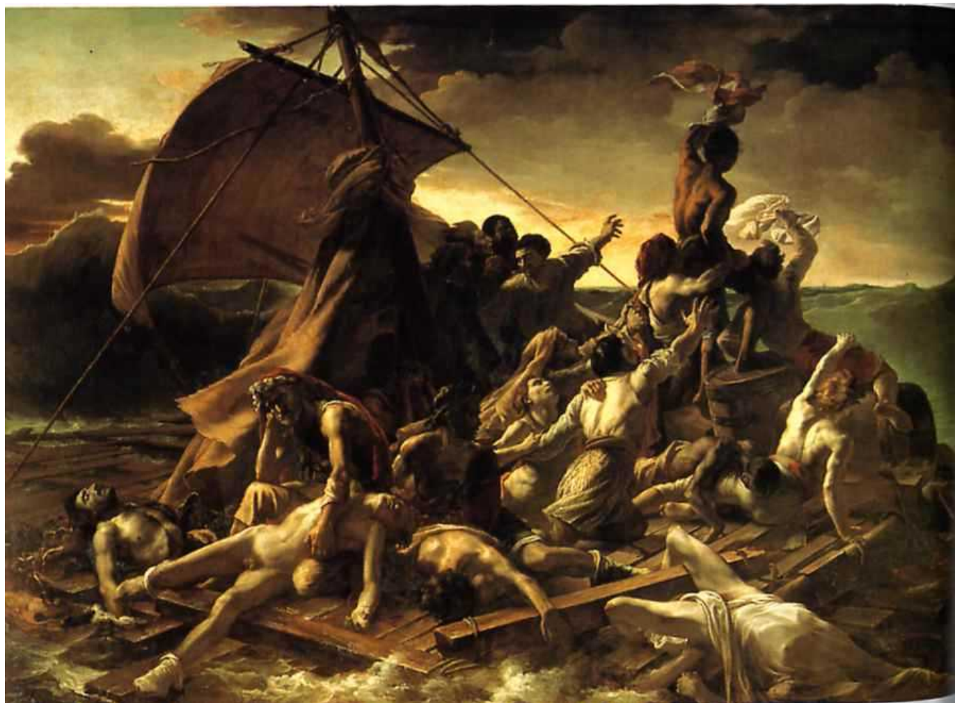
La zattera della Medusa - 1818-19