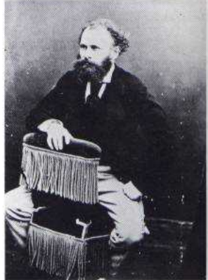
Nadar, Edouard Manet, pittore e litografo, 1865 ca.