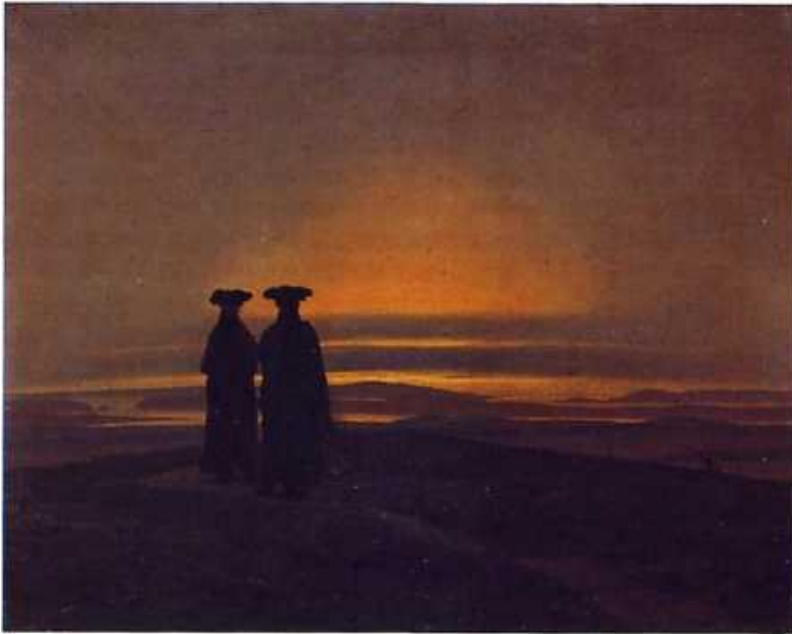
Il tramonto: fratelli 1830

Finitezza dell'uomo e infinità della natura