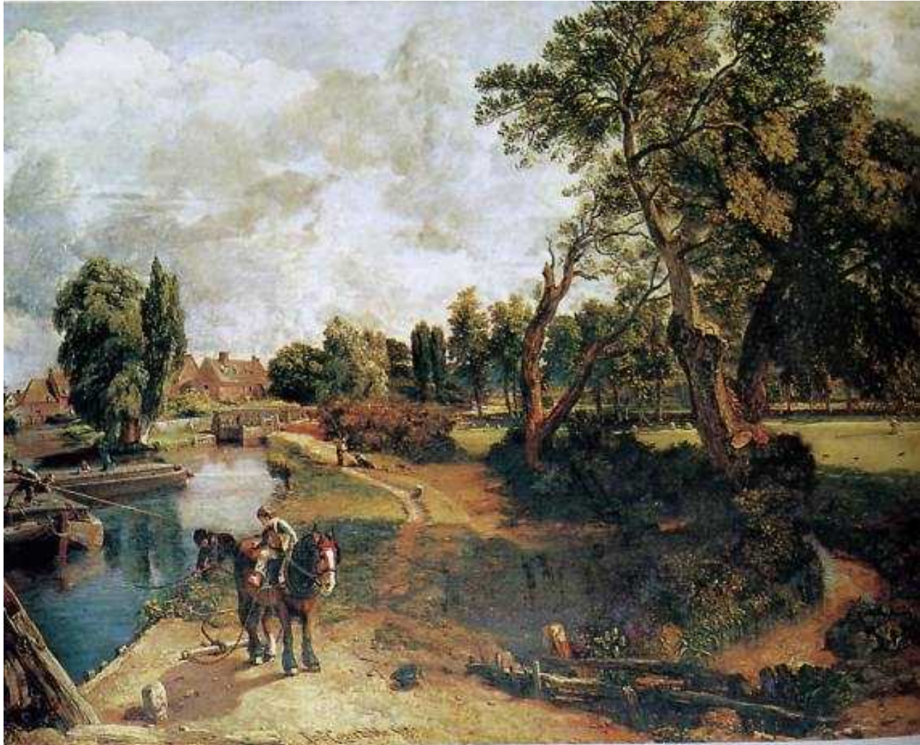
CONSTABLE "Flatford Mill 1817