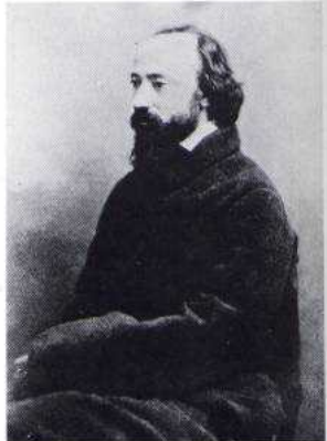
Nadar, Charles François Daubigny, pittore e acquafortista della scuola di Barbizon, 1855-60 ca. 1858.