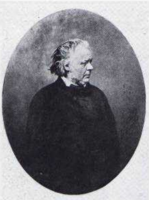
Nadar, Honoré Daumier, pittore, litografo e scultore, noto per la sua opera satirica, 1855.