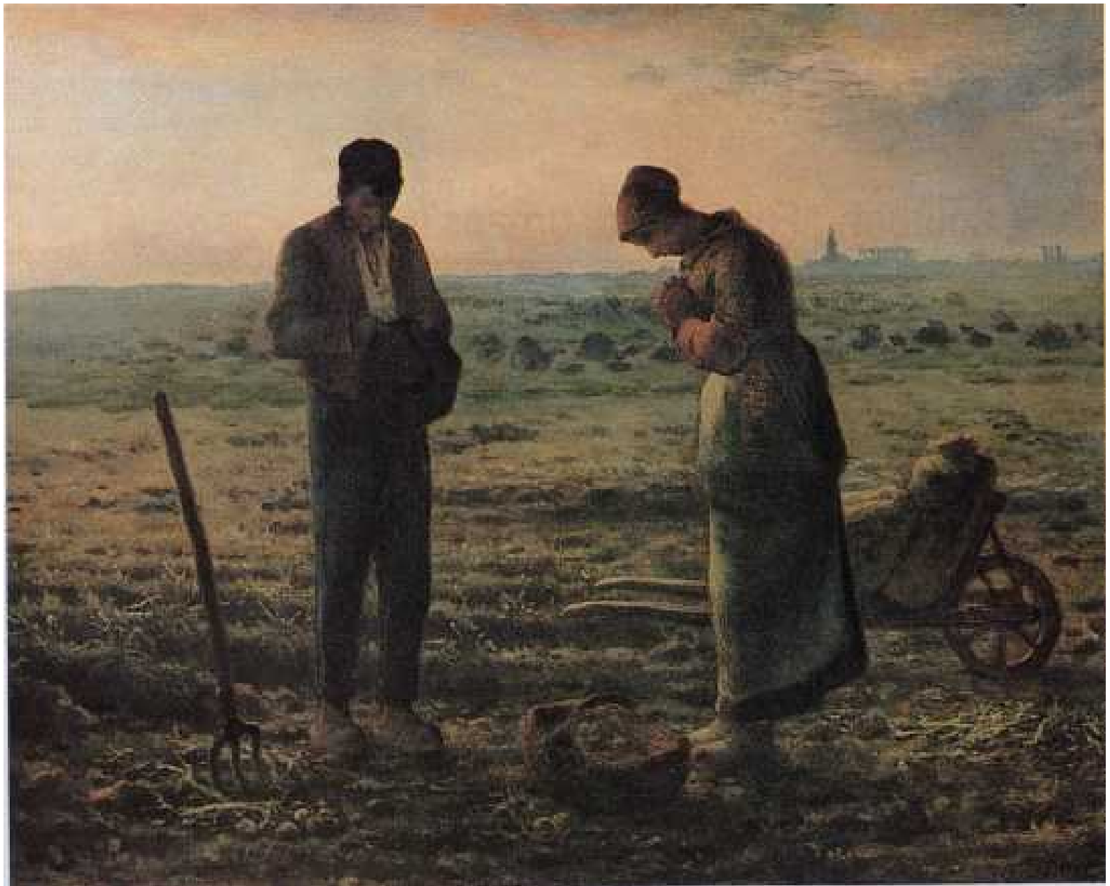
MILLET Angelus 1859