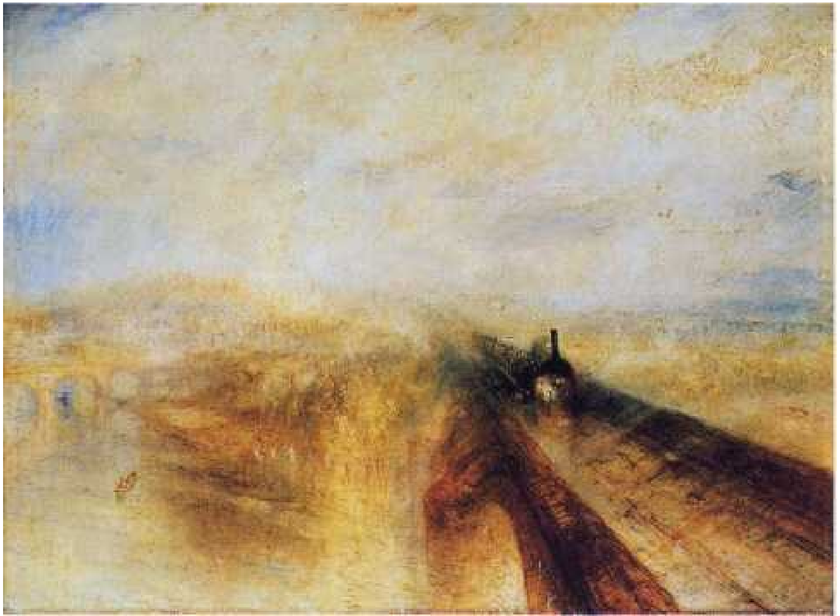
Pioggia, vapore, velocità 1844