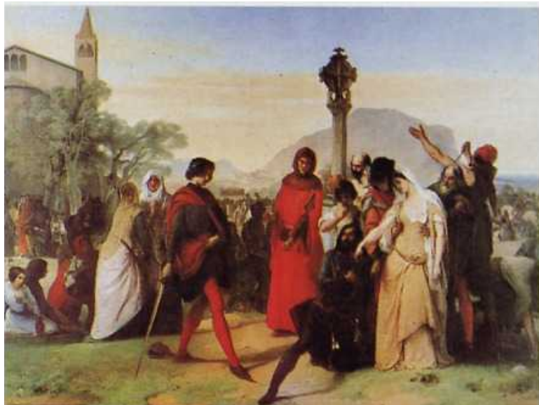
Vespri siciliani 1846