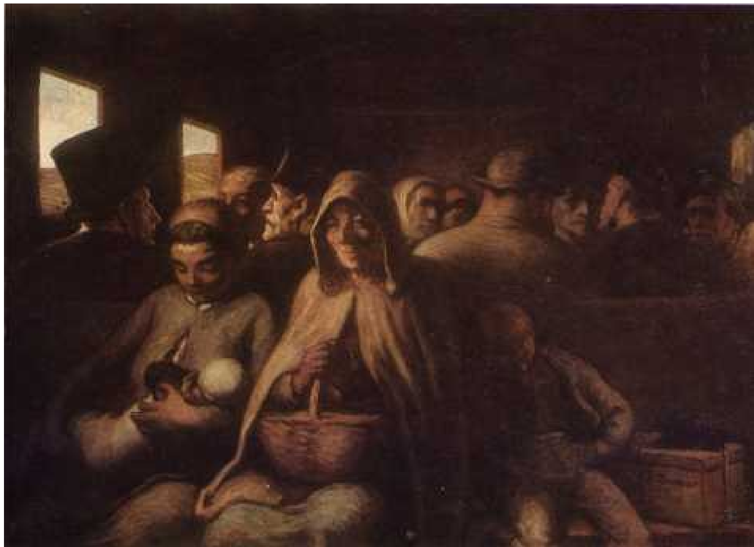
HONORE' DAUMIER Vagone di terza classe 1862