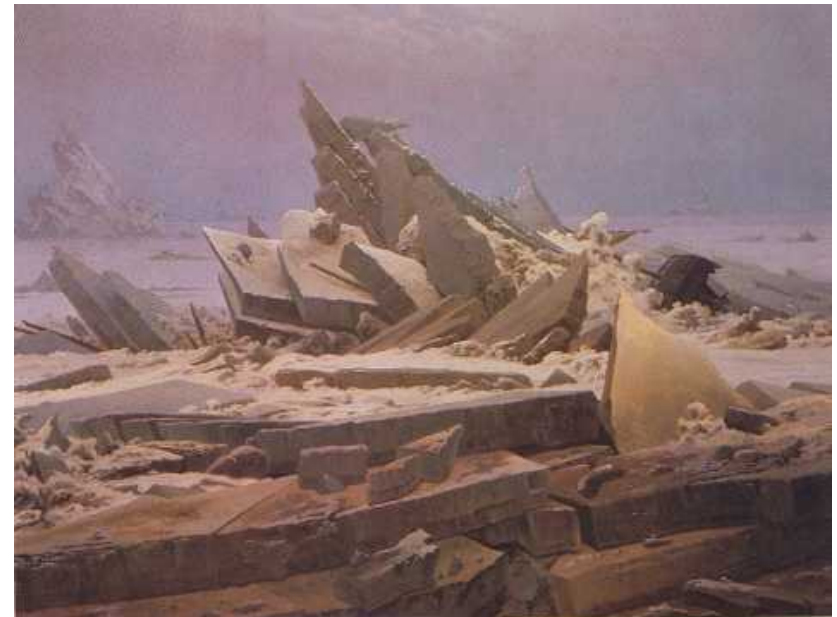
Naufragio della Speranza 1822