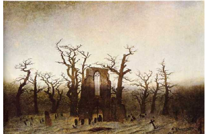
Abbazia nel querceto 1809