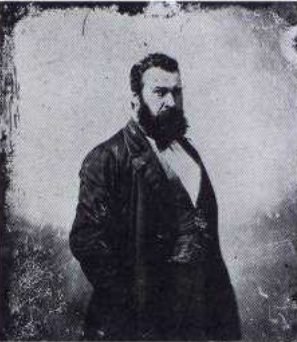
Nadar, Jean François Millet, pittore, incisore, soprannominato a suo tempo il Michelangelo dei contadini, 1860 ca.