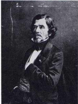
Nadar, Eugène Delacroix, pittore e litografo considerato come il gran maestro dell'età romantica, 1858.