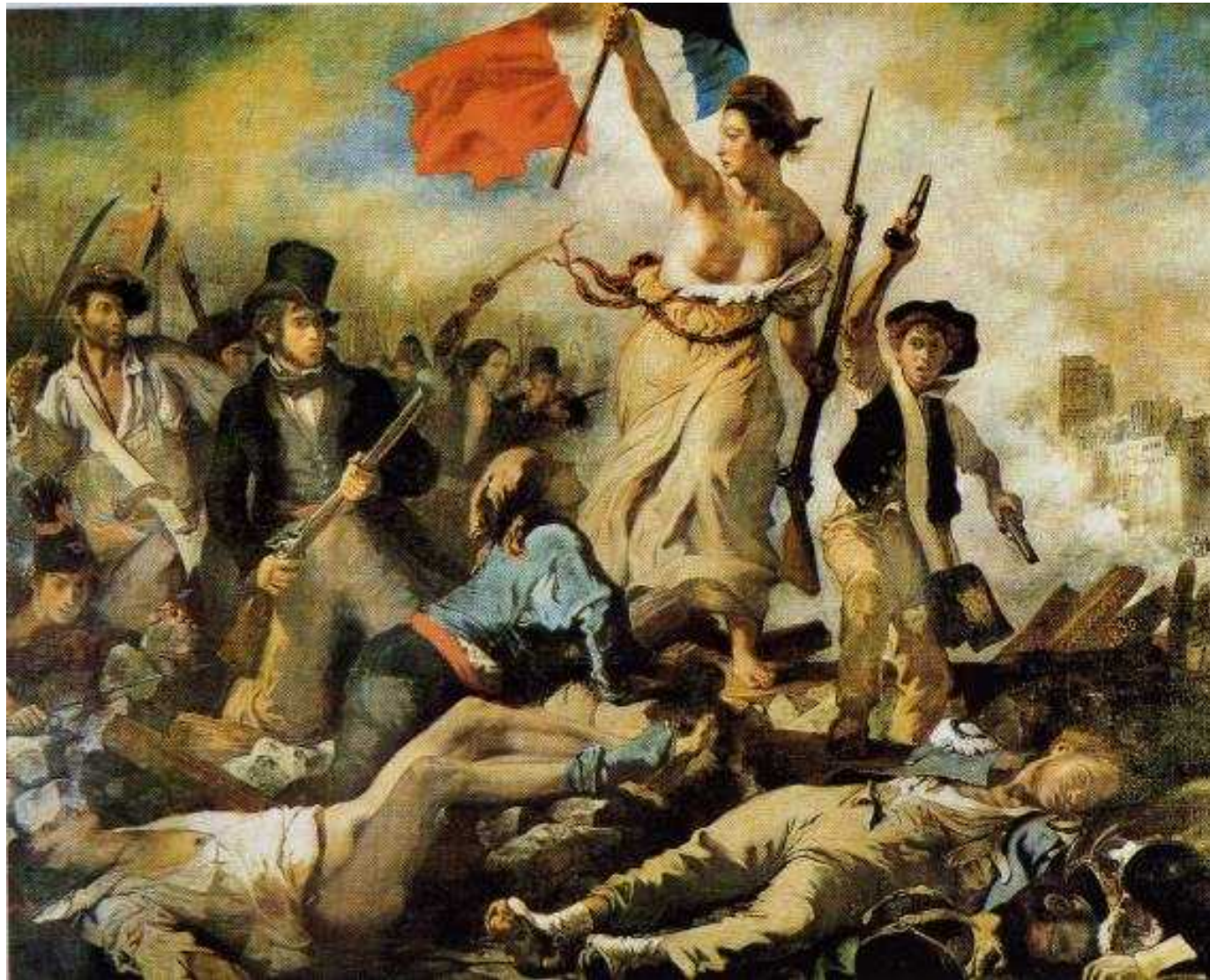
La Libertà guida il popolo 1830