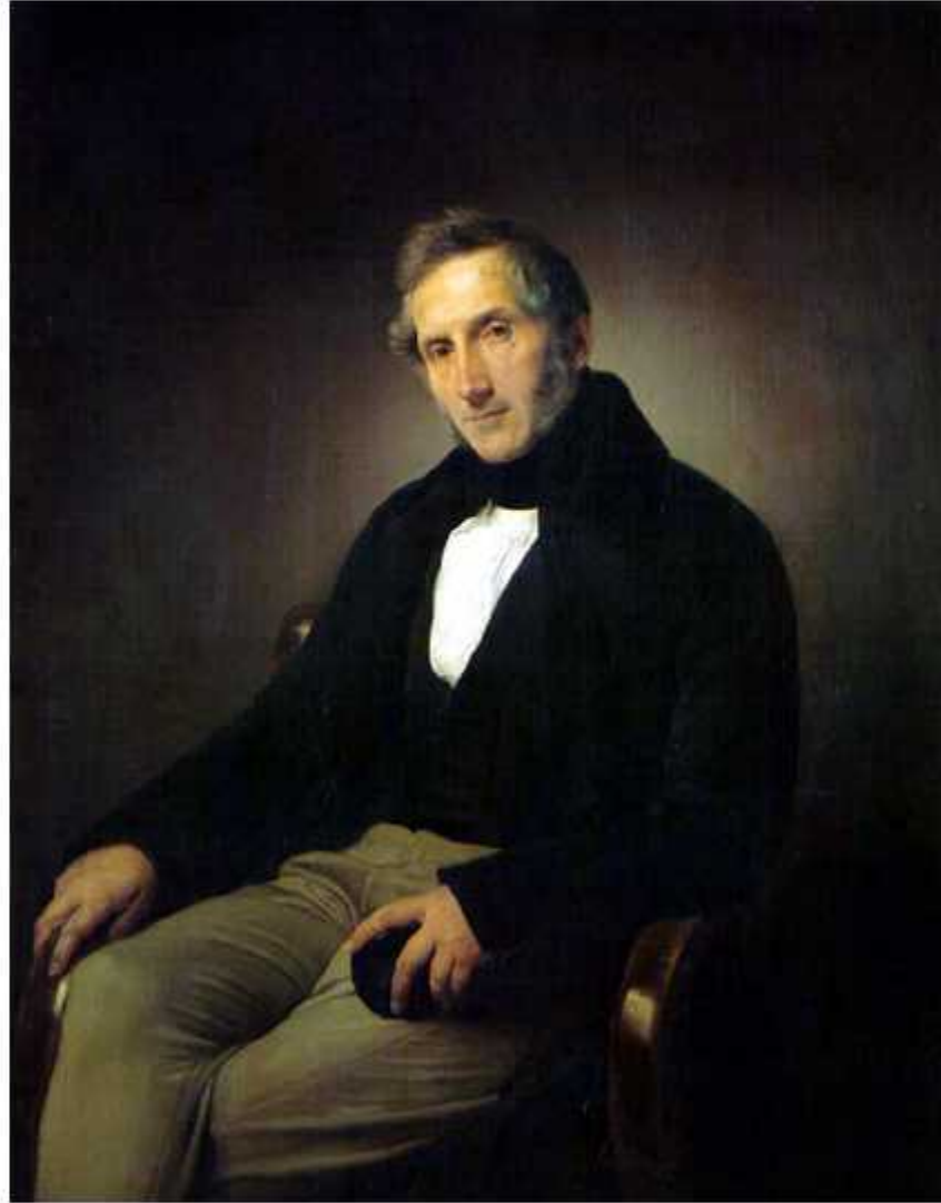
Francesco Hayez, Ritratto di Alessandro Manzoni, Pinacoteca di Brera, Milano