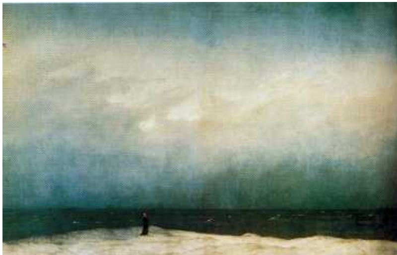
Monaco in riva al mare 1809