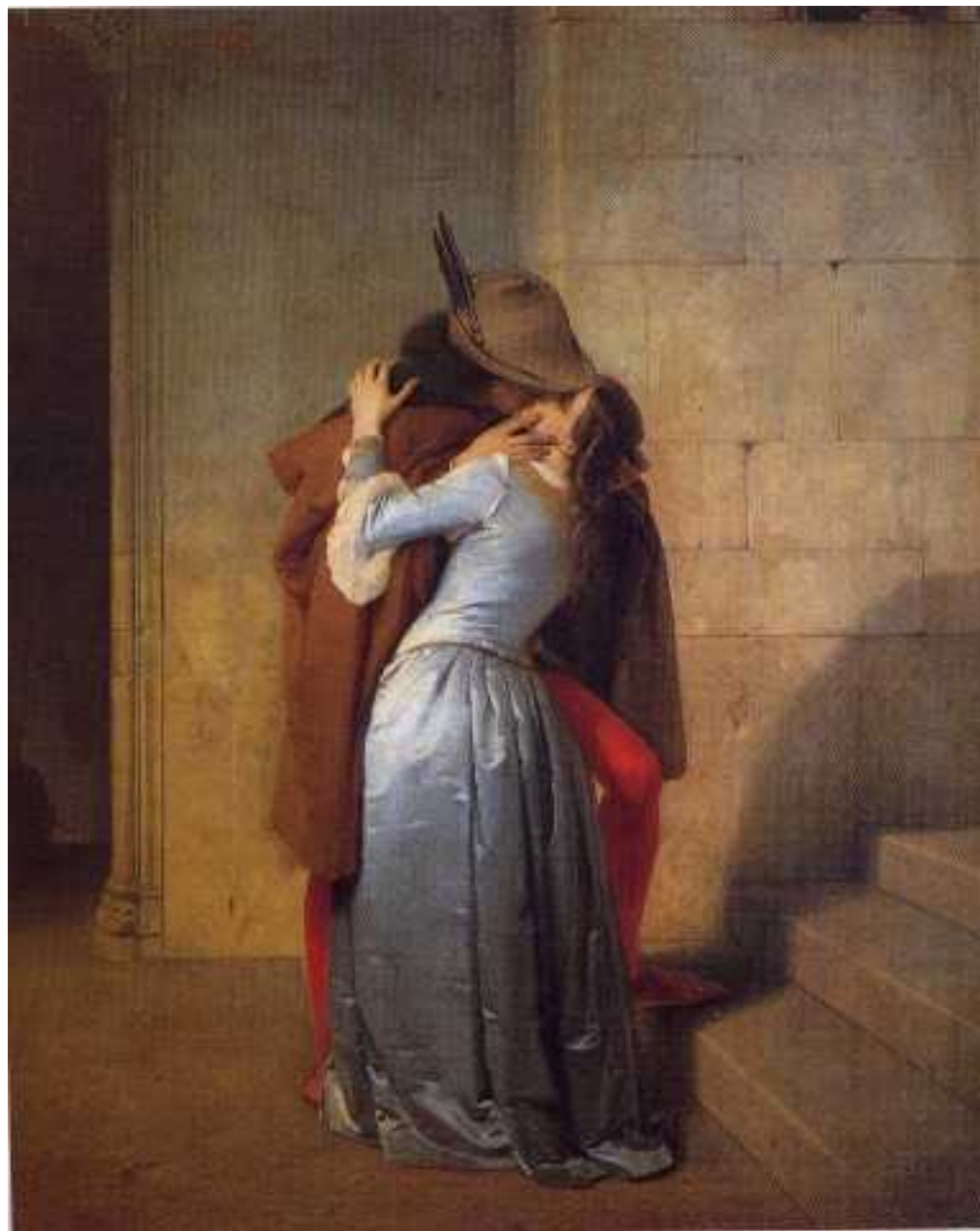
Il bacio 1859