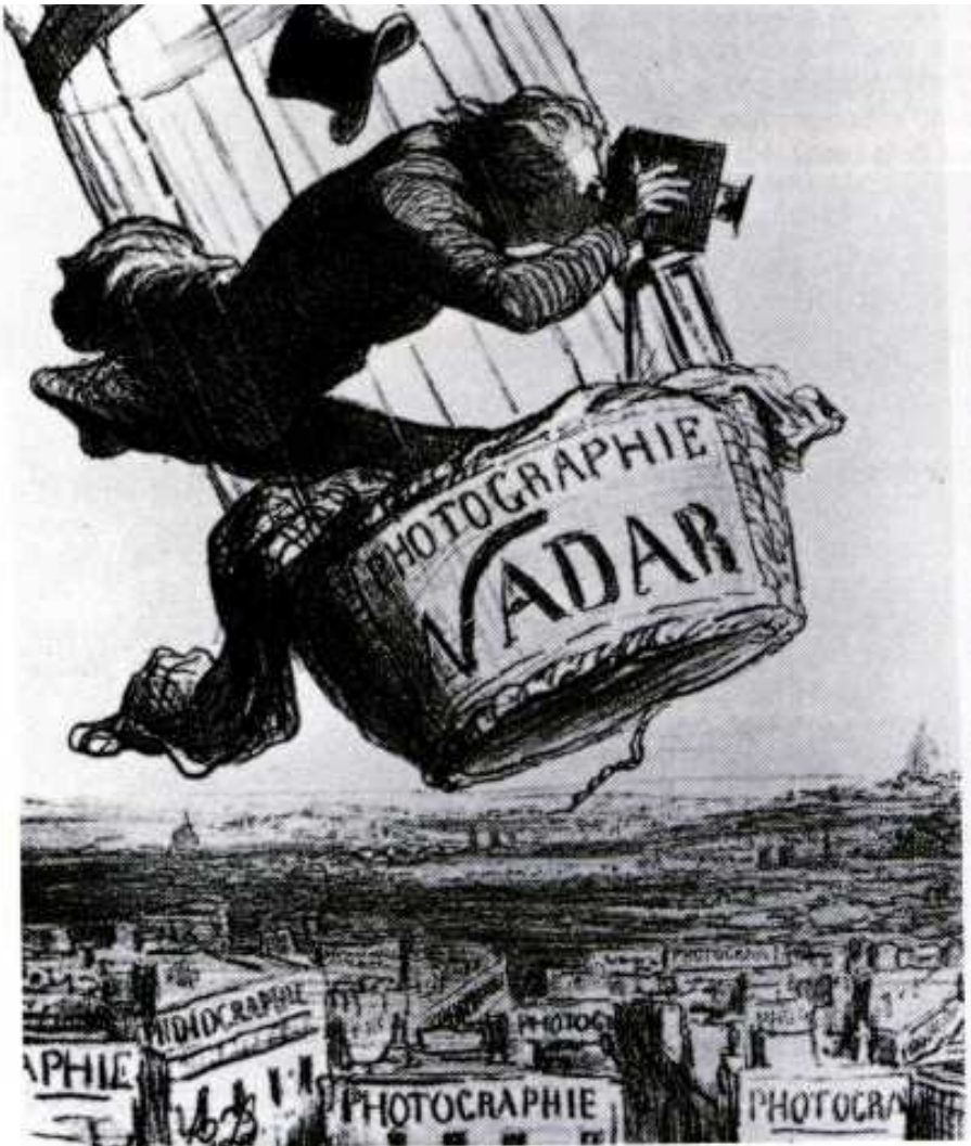
Honoré Daumier : Nadar innalza la fotografia a dignità d'arte litografia 1862