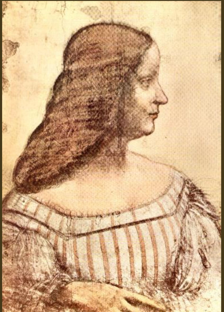
Leonardo da Vinci, Isabelle d'Este, 1499