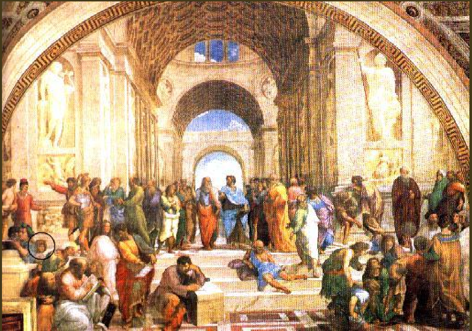
Raffaello, 1509, Scuola di Atene, Stanze Vaticane (della segnatura)