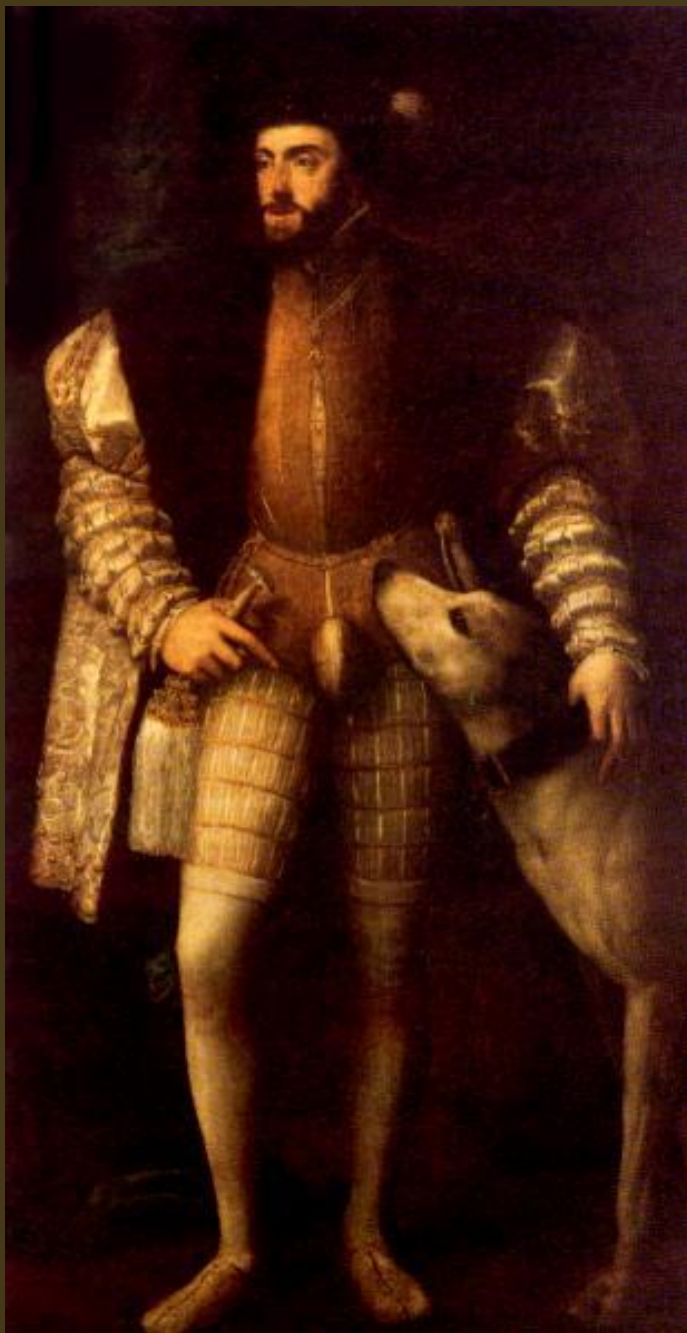
Tiziano, 1532-33 Ritratto di Carlo V