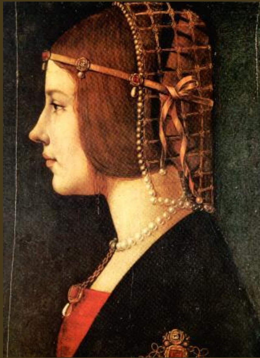
Leonardo, De Predis; 1485; Beatrice d'Este (moglie del Moro)