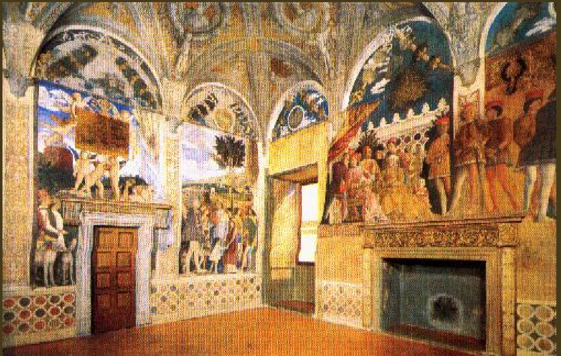
La Camera degli sposi A. Mantegna; 1465-74; Mantova, Castello di S.Giorgio