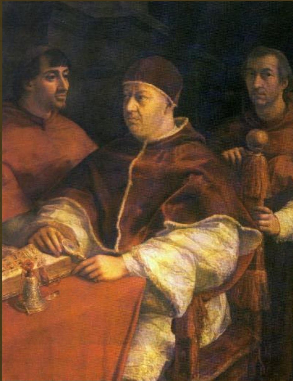
Raffaello, 1518-19, Leone X con i cardinali Giuliano de' Medici e Luigi de' Rossi