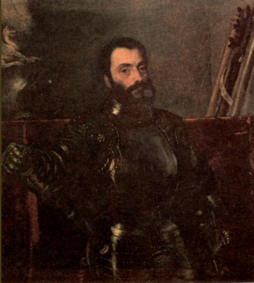
Tiziano, 1536-38, Francesco Maria Della Rovere