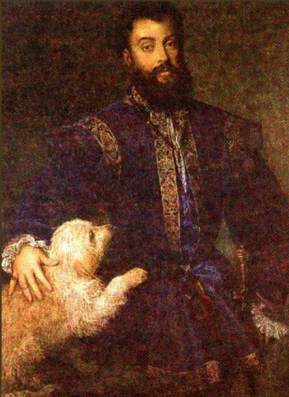
Tiziano, 1525, Federico II Gonzaga