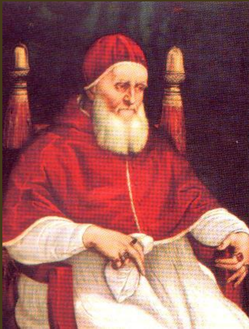
Raffaello, 1511-12, Ritratto di Giulio II