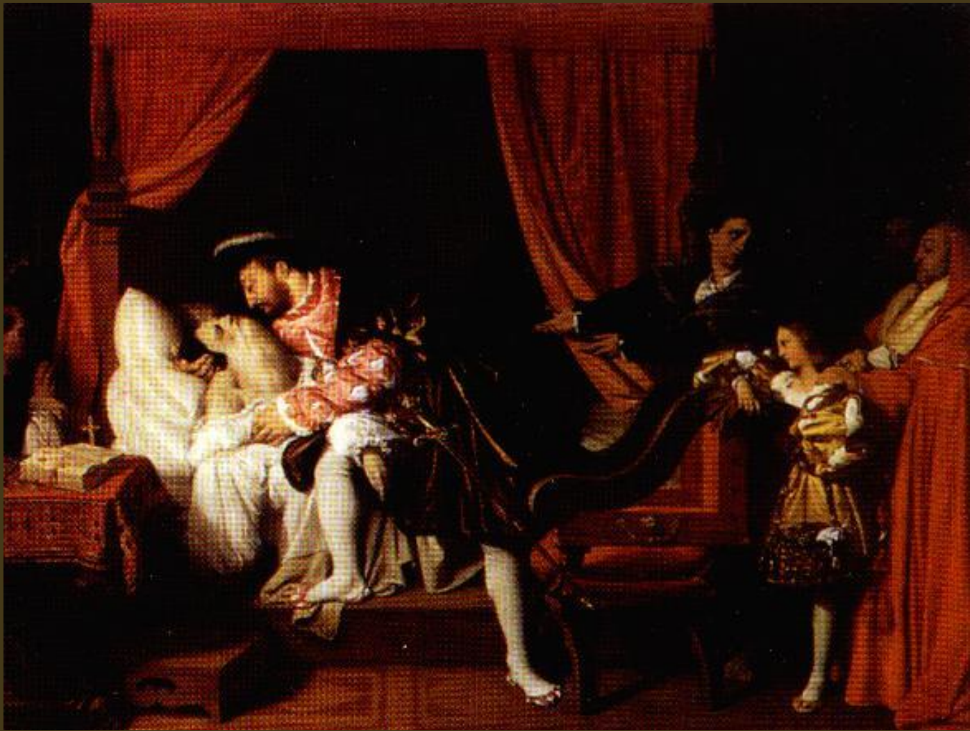
Ingres (1818); Leonardo muore tra le braccia di Francesco I