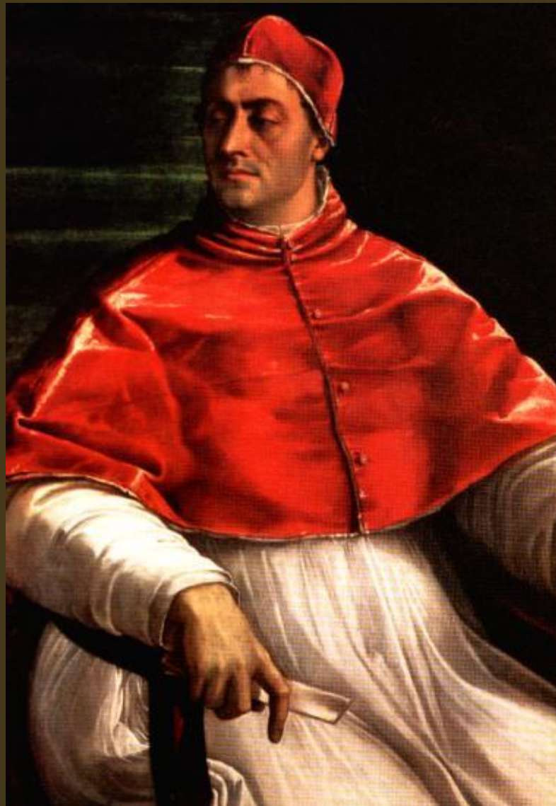
Sebastiano del Piombo, 1526, Ritratto di Clemente VII