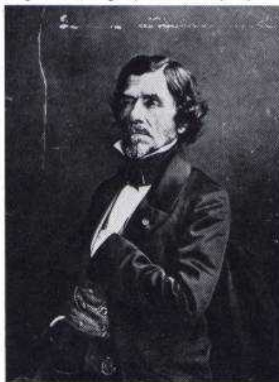
Nadar, Eugène Delacroix, pittore e litografo considerato come il gran maestro dell'età romantica, 1858.