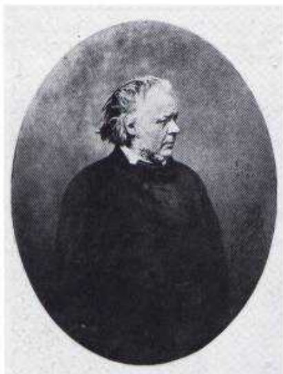
Nadar, Honoré Daumier, pittore, litografo e scultore, noto per la sua opera satirica, 1855.