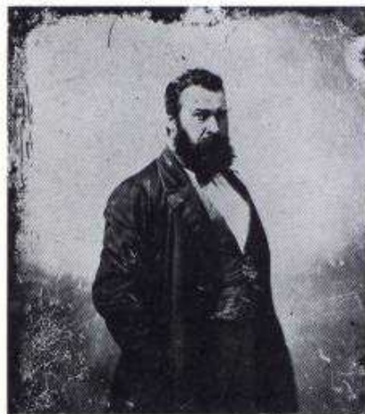
Jean François Millet, pittore, incisore, soprannominato a suo tempo il Michelangelo dei contadini, 1860 ca.