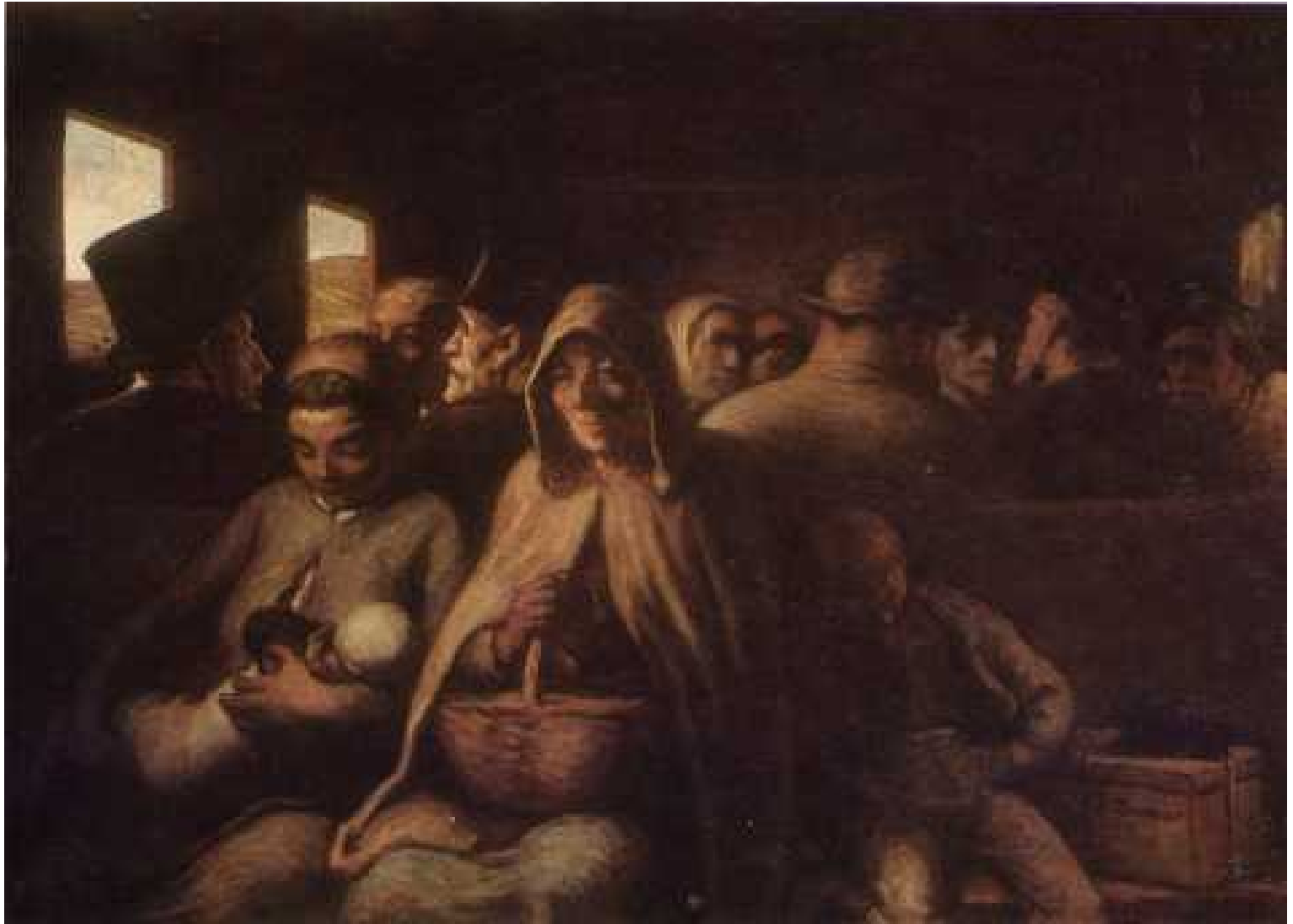
HONORE' DAUMIER Vagone di terza classe 1862