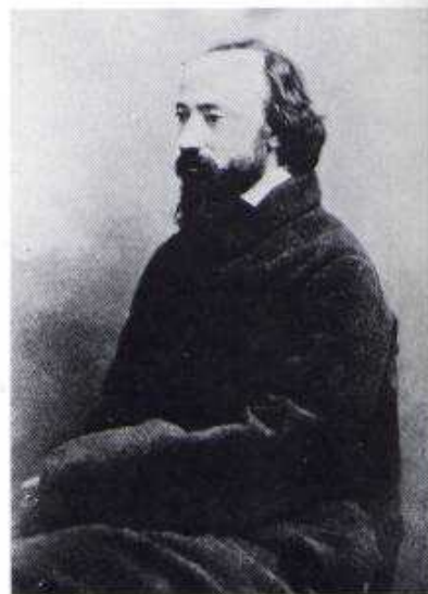
Nadar, Charles François Daubigny, pittore e acquafortista della scuola di Barbizon, 1855-60 ca.