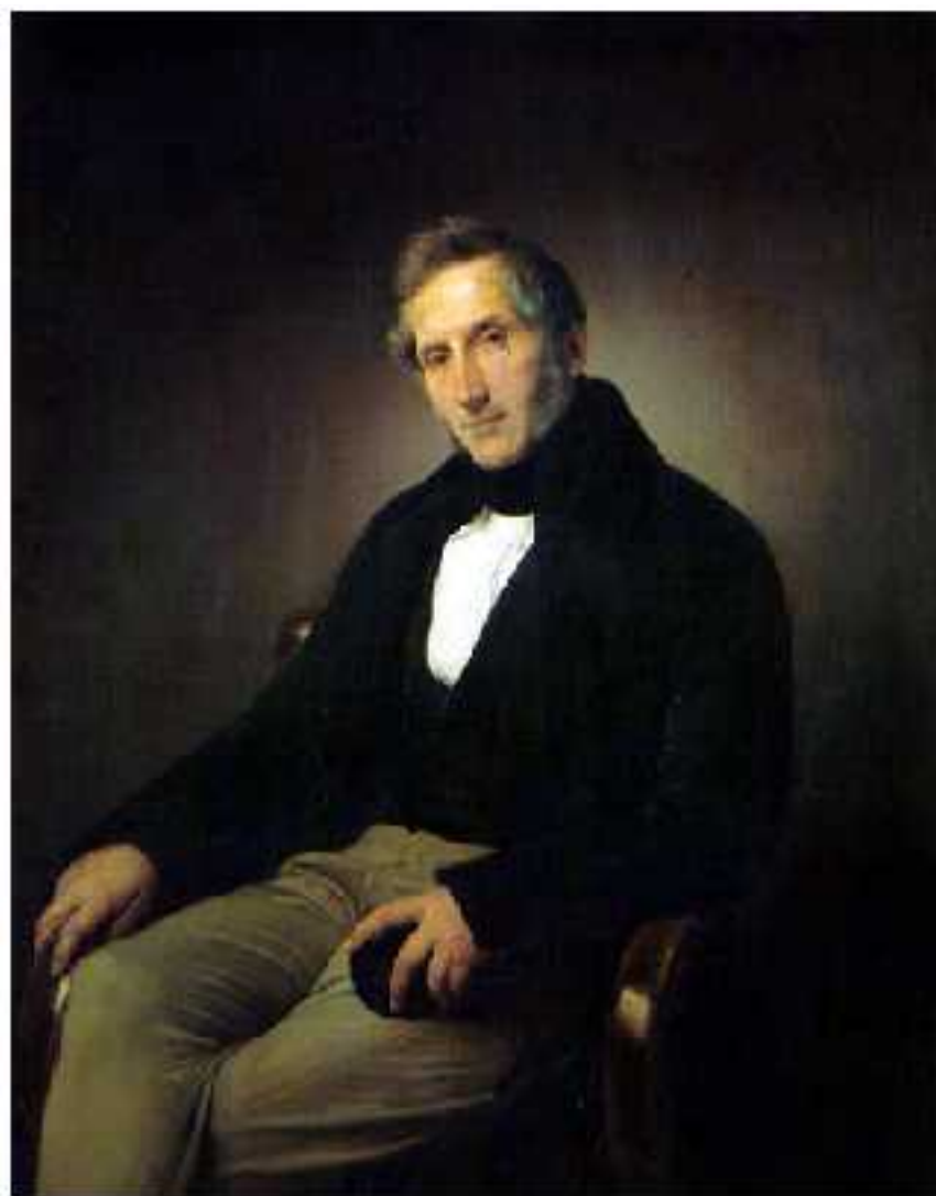
Francesco Hayez, Ritratto di Alessandro Manzoni, Pinacoteca di Brera, Milano