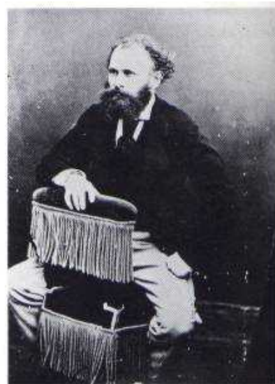
Nadar, Edouard Manet, pittore e litografo, 1865 ca.