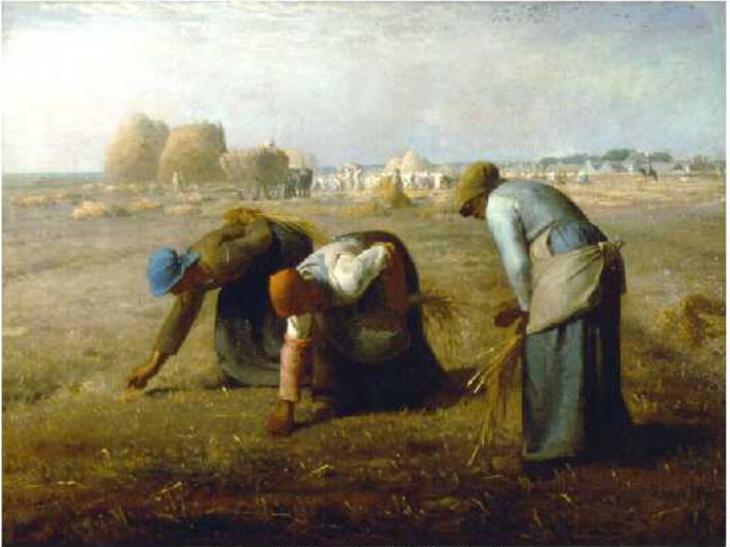
Jean-François Millet, Le scribe d'herbe, 1865, Musée d'Orsay, Paris