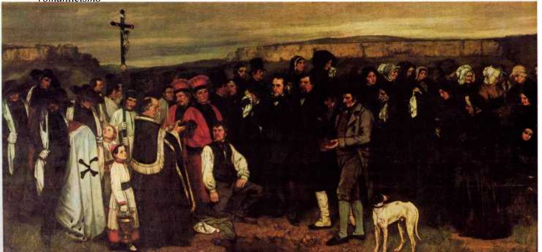
Funerale di Ornans 1849 “funerale del romanticismo”