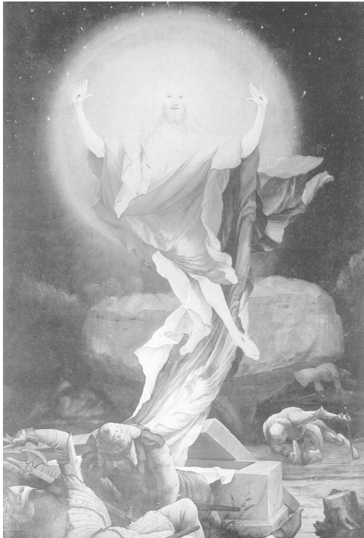
Auferstehung und Himmelfahrt Christi Matthias Grünewald, Isenheimer Altar

Über der Erdschwere, verdichtet in einem ungeheuer großen Felsblock, schwebt der Auferstandene als verklarte Lichtgestalt, aller irdischen Stofflichkeit entkleidet. Sein Gesicht ist von der Herrlichkeit Gottes umgeben, die ihn in ihr Licht aufnimmt. Seine erhobenen Arme bilden mit seinem Gesicht ein Omega. Denn er ist der Erste und der Letzte (Jes 44,6; Offb 1,17). Durch den Kyrios ist Jahwe anschaulich geworden.