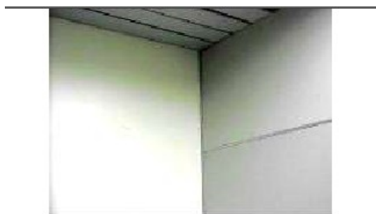
Exemplo de paredes com cores adequadas