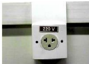
Tomada tripolar monofásica (3 pinos) padrão NEMA 5P