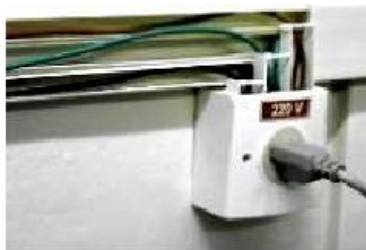
Exemplo de canaleta externa para passagem da fiação elétrica