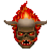
Alma en pena.