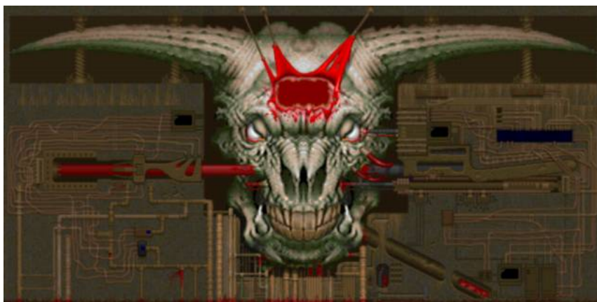
Icono del pecado (a un tercio de escala).