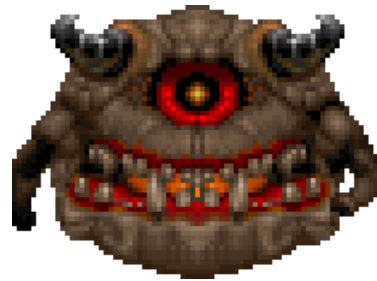
Elemental del dolor.