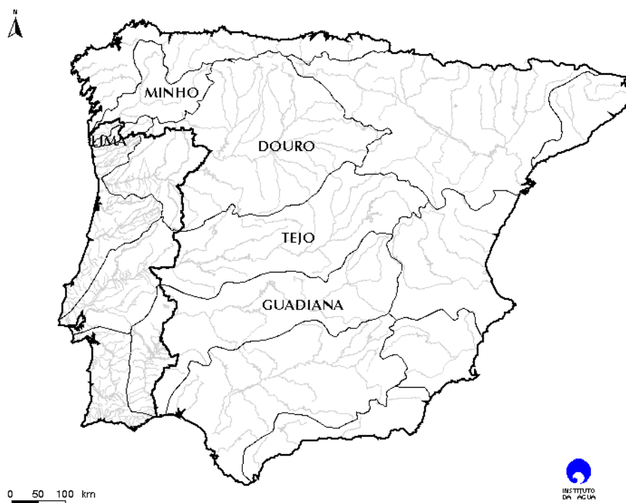
Figura 1 – Bacias Hidrográficas Luso-Espanholas

Os problemas dos recursos hídricos com que hoje Portugal se defronta são muito diferentes, e incomparavelmente mais complexos, do que os que nortearam quer o planeamento hidráulico quer os Estudos das Regiões de Saneamento Básico da década de 70. Sendo os recursos hídricos limitados, verificam-se dificuldades cada vez maiores em satisfazer o incremento das necessidades de água e em controlar adequadamente a qualidade da água dos meios hídricos. A grande variação da distribuição espacial e temporal dos recursos hídricos, característica de Portugal, exige a mobilização de avultados recursos financeiros para a implementação das obras e outras medidas que assegurem a disponibilização de água quando e onde é necessária para o abastecimento urbano e para as actividades sócio-económicas, a recuperação e a prevenção da degradação da qualidade da água e dos meios hídricos, bem como para a protecção de pessoas e bens face à ocorrência de cheias, secas e incidentes de poluição accidental. Por outro lado, a conservação da natureza, em particular a protecção dos ecossistemas aquáticos e ribeirinhos, que passou a figurar nas agendas das políticas de gestão dos recursos hídricos a partir do final da década de 80, impõe restrições às utilizações crescentes da água, às modificações do regime hidrológico dos cursos de água e às alterações da qualidade dos meios hídricos. A água passou a ser reconhecida como um património comum.