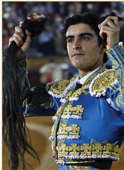
Oliveñca, 02/03/08 - CORRIDA DE TOIROS 17h30m:

Toiros de Zaldueño, bons colaboradores, destacando-se o segundo, quinto e sexto toiro, todos de apresentação variável, mas que permitiram o enorme luzimento desta tarde. Julian Lopez "El Juli" (orelha, duas orelhas) José Mari Manzanares (orelha, duas orelhas) Miguel Angel Perera (ovação, duas orelhas e rabo).