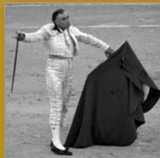
"El Pana", en MADRID David Cordero lo retrató para NATURALES