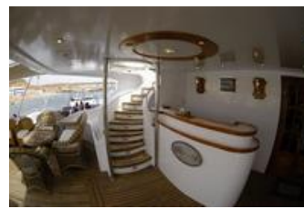
100 sqm Sundeck