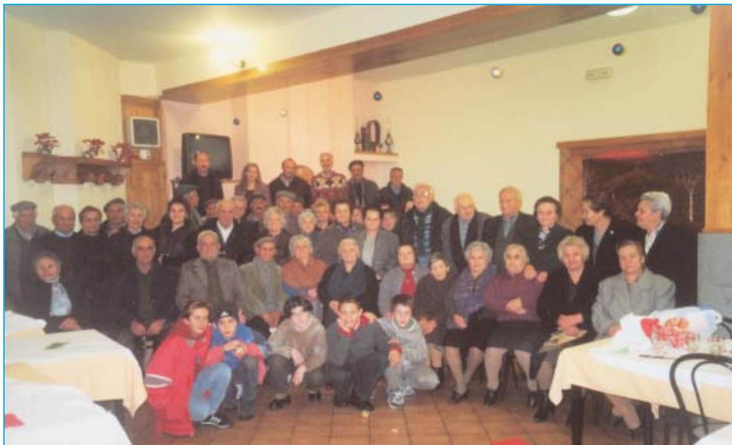
Gli Anziani con gli Amministratori ed i Baby Consiglieri.