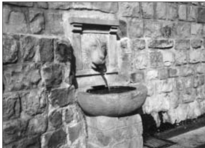
Particolare della sorgente "Fontana grande".