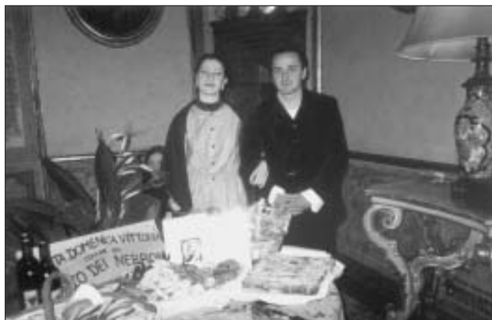
Esposizione dei prodotti tipici locali.