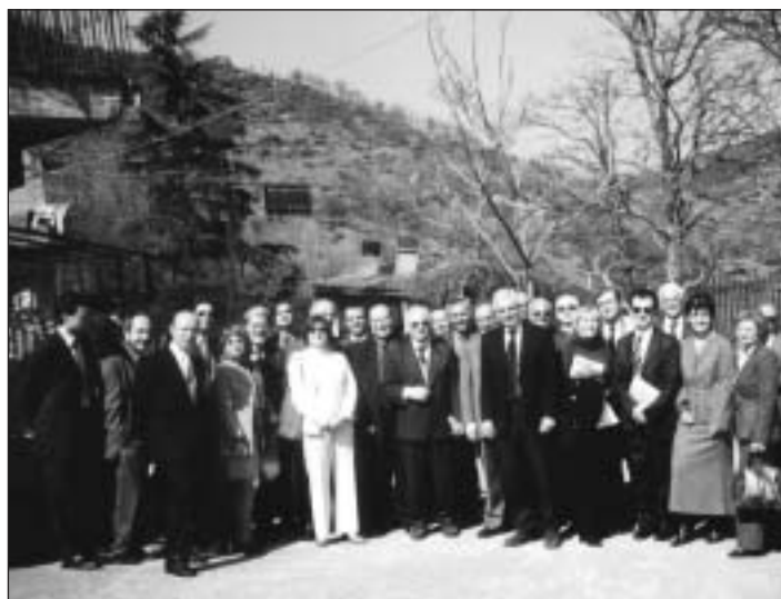
Foto – ricordo degli ospiti Europei con il Sindaco di Santa Domenica Vittoria.

Al suddetto seminario hanno partecipato eminenti personalità provenienti dalle varie Nazioni Europee, tra cui il Dott. Michal Radlicki, Ambasciatore della Repubblica di Polonia.