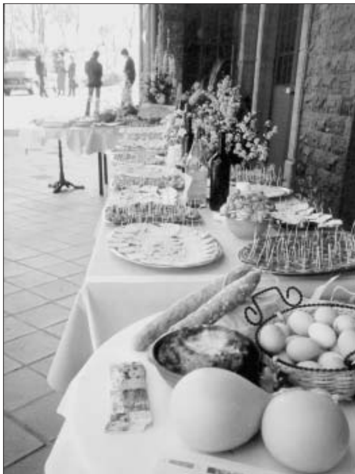
Il buffet dei prodotti tipici offerto dall'Amministrazione Comunale.