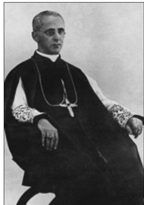
S. Ecc. Mons. Pio Giardina.

Le parole di Mons. Pio Giardina che ho voluto riportare alla luce, e vi prego di ascoltarle con commossa attenzione, perchè tornano a risuonare quasi dopo un secolo, parlano di derelitti che hanno conquistato la possibilità di associarsi per recuperare la loro dignità, per uscire dalla categoria dei servi e rivendicare il diritto di essere uomini. Pio Giardina pronunciò i due discorsi, di cui riportiamo alcuni passi, nel 1908: il primo per l'anniversario di fondazione di una Società operaia cattolica di cui si inaugurava la sede, costituita con il sostegno genero-