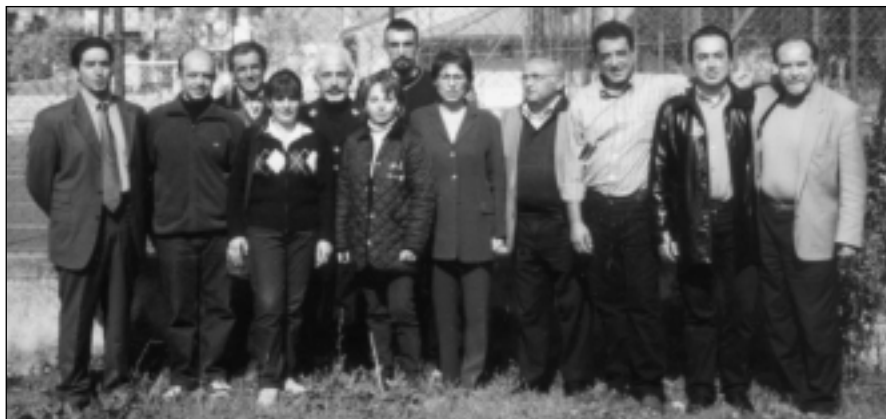
I fondatori della "Pro Loco".