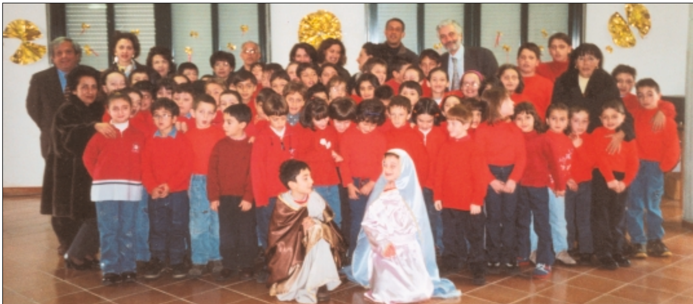
20 Dicembre 2000 – Centro diurno: recita natalizia degli alunni delle Scuole Elementari con canti tradizionali, anche in dialetto siciliano ed in francese. Nella foto - ricordo i bambini insieme alle Autorità scolastiche ed al nostro primo Cittadino.