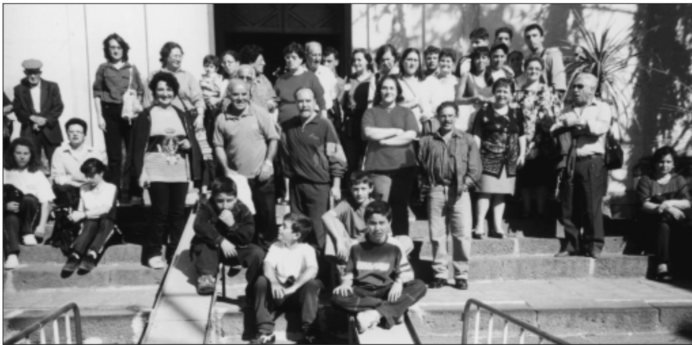
Domenica 24 Settembre 2000 – Piazzale antistante la Chiesa di Mojo Alcantara. Un gruppo dei nostri 118 Concittadini che, come da tradizione ventennale, si sono recati in Pellegrinaggio a piedi a Mojo Alcantara per venerare il Cristo di Fra' Umile da Petralia.