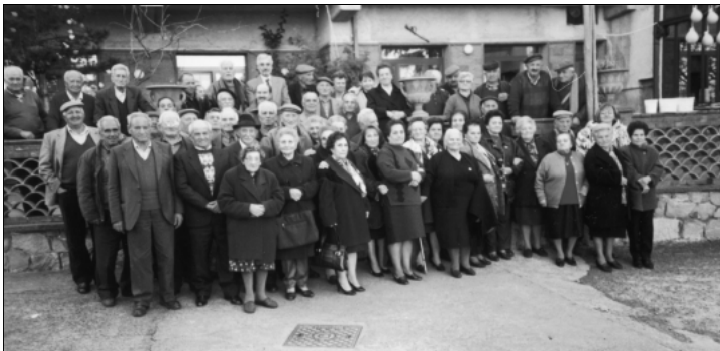
6 gennaio 2001: foto ricordo del "Pranzo di buon anno" per i nostri anziani.