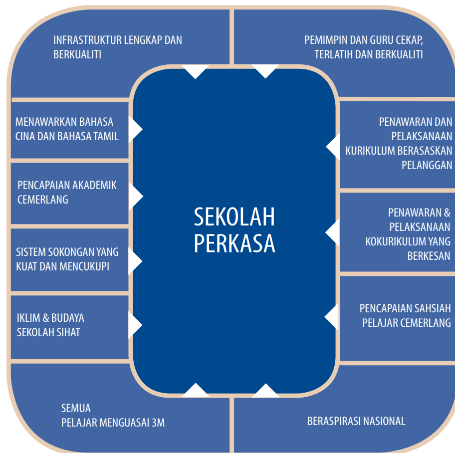
Rajah 6.1 Ciri-Ciri SK Perkasa

murid bukan Bumiputera di SK yang terletak di kawasan yang mempunyai pelbagai kaum khususnya di bandar.