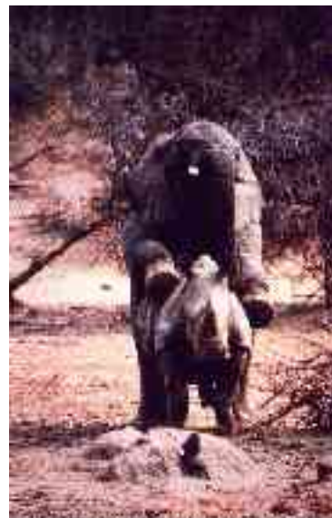
El animalo animal presento a una de sus crías.

En su informe provisional sobre la trágica muerte de las vacas, Melester opina que los hechos tienen un móvil sexual y que el trato que recibieron los animales no indica que el oso buscara sólo comida. Según el experto, la conducta del plantigrado puede describirse como "molestias sexuales", ya que fue atraído por los efluvios de las vacas, 13 de las cuales estaban preñadas, lo que las convirtió en presa fácil. Las otras cinco estaban en celo, lo que explica el ataque del plantigrado, algo no tan extraño en el mundo animal, donde se conocen montas de vacas en celo por alces machos.