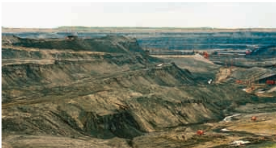
Au Canada le pétrole est extrait de sables bitumineux, dont il existe des quantités gigantesques.

Réd.: l'exploitation de ces ressources induit de gros mouvements de terre.