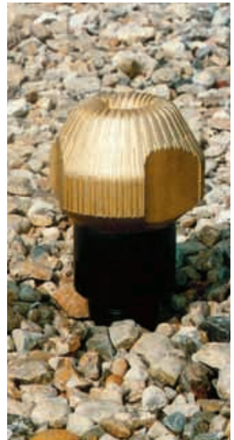
Selon la roche, la tête de forage doit être changée tous les 150 à 200 m.