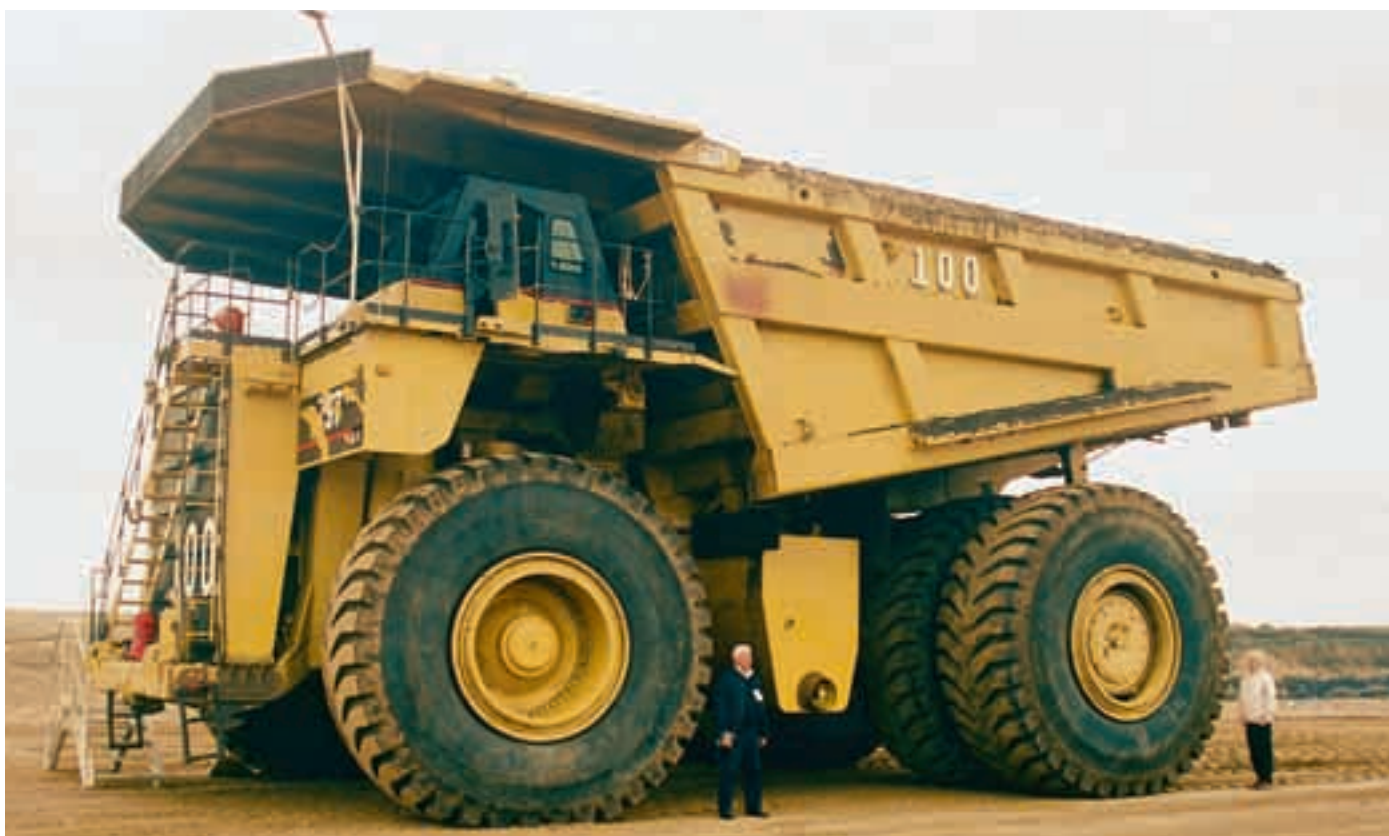
Ce 320-tonnes ne serait pas vraiment adapté à nos conditions routières.