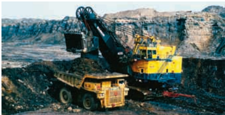
La dimension des infrastructures pour l'extraction des sables bitumineux est à peine imaginable.

R. Hartl: c'est une question de point de vue. Cependant, il est certain que dans l'Alberta il n'existe pratiquement pas d'opposition à l'industrie pétrolière. L'importance économique de cette industrie est reconnue par la politique. Le fait que ce type de ressource d'énergie représente une indépendance certaine face aux autres pays, est un argument de taille.