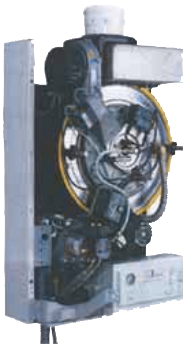
Sécurité et efficacité élevée réunis en une seule chaudière murale.

Les chaudières couvrent la gamme de puissance entre 12 et 18 kW. Grâce à la technique de condensation, ces chaudières atteignent des degrés d'efficacité extrêmes. La nouvelle chaudière murale s'installe n'importe où. Le système d'apport d'air et d'évacuation des fumées indépendant de l'air ambiant donne une flexibilité particulièrement élevée pour le montage et l'emplacement.