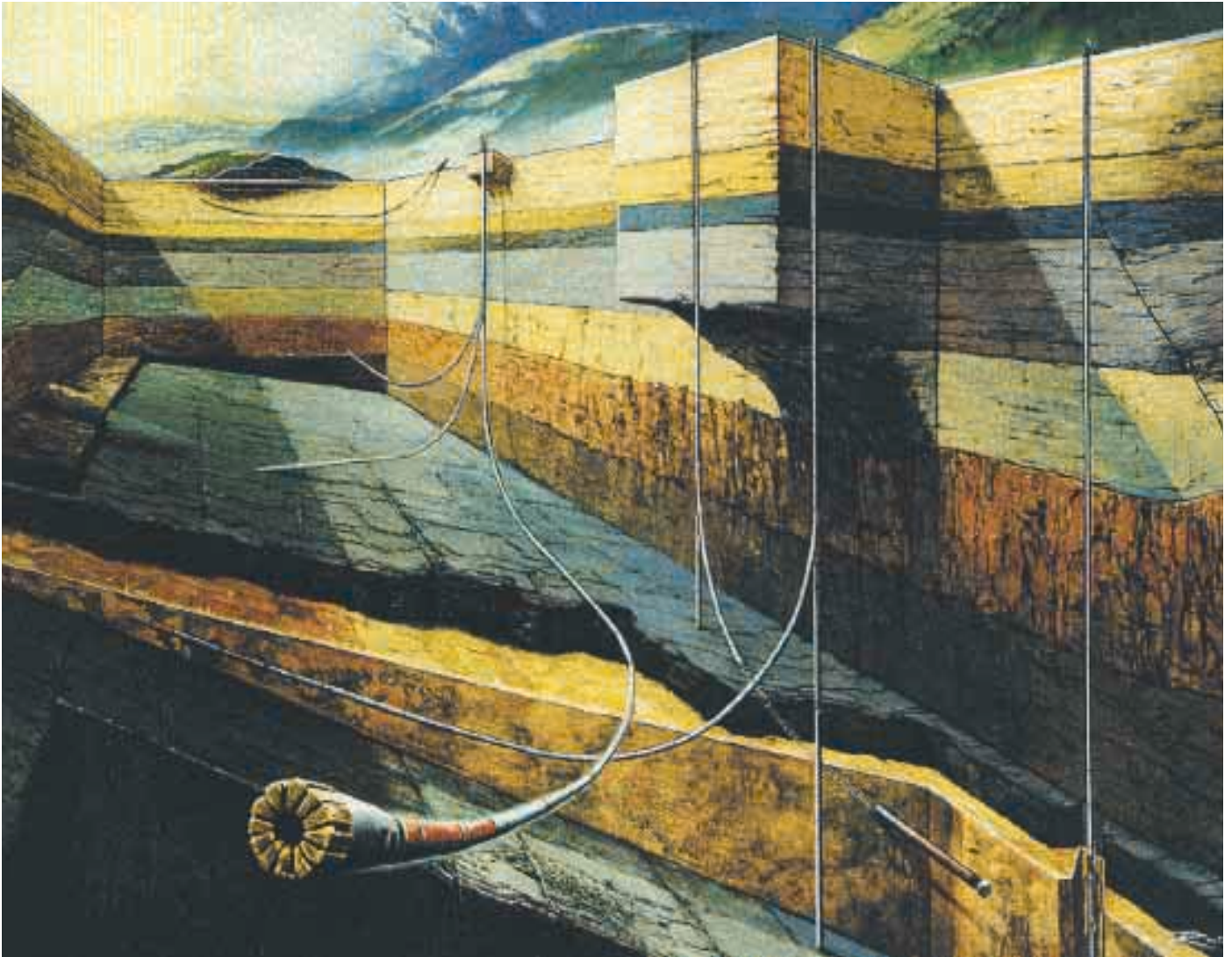
Grâce à des forages verticaux et horizontaux, on peut exploiter divers gisements de pétrole à partir d'un seul puits.