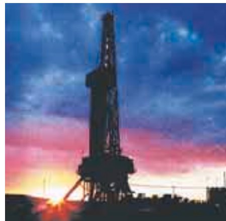
Les gisements de pétrole sont suffisants pour des générations.

Fin 2001, les réserves de pétrole mondiales connues se chiffraient à 143 milliards de tonnes, correspondant à 1,05 billions de barils. L'année d'avant elles n'étaient que de 142 milliards de tonnes. Près des deux tiers de ces gisements se situent dans le Moyen Orient. Par contre, les réserves européennes sont modestes: seulement 2,5% des gisements de pétrole