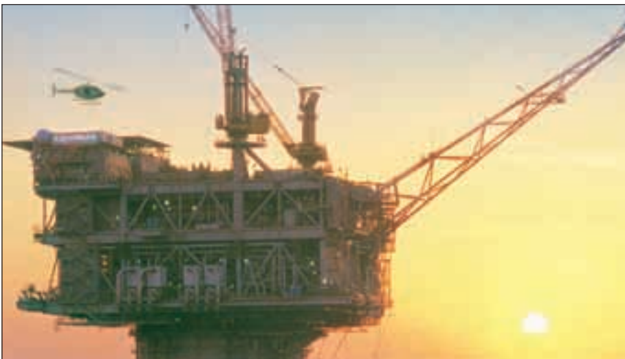
L'extraction du pétrole met en œuvre une technologie très avancée.

énormes de minuscules organismes vivants, surtout des algues, bactéries et champignons. Ces organismes ont été précipités au fond des mers et y pourrissaient si la présence d'oxygène était suffisante. Sinon, la substance organique telle quelle se combinait aux sables les plus fins pour former des vases qui produisaient des schistes argileux sous la pression de dépôts ultérieurs. La teneur