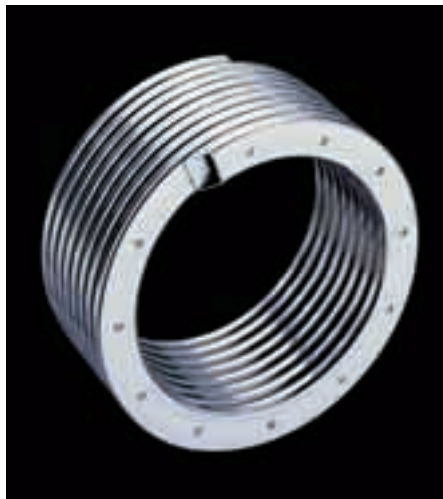
Une pièce centrale de la chaudière, l'échangeur de chaleur en acier inox.