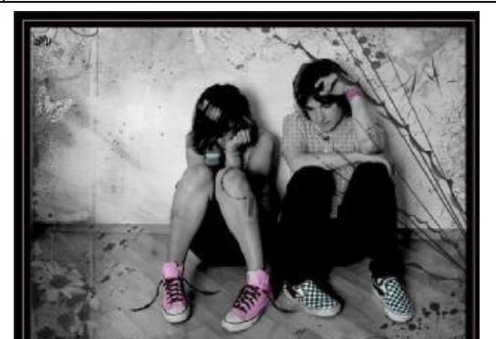
Signos que usan los Emos