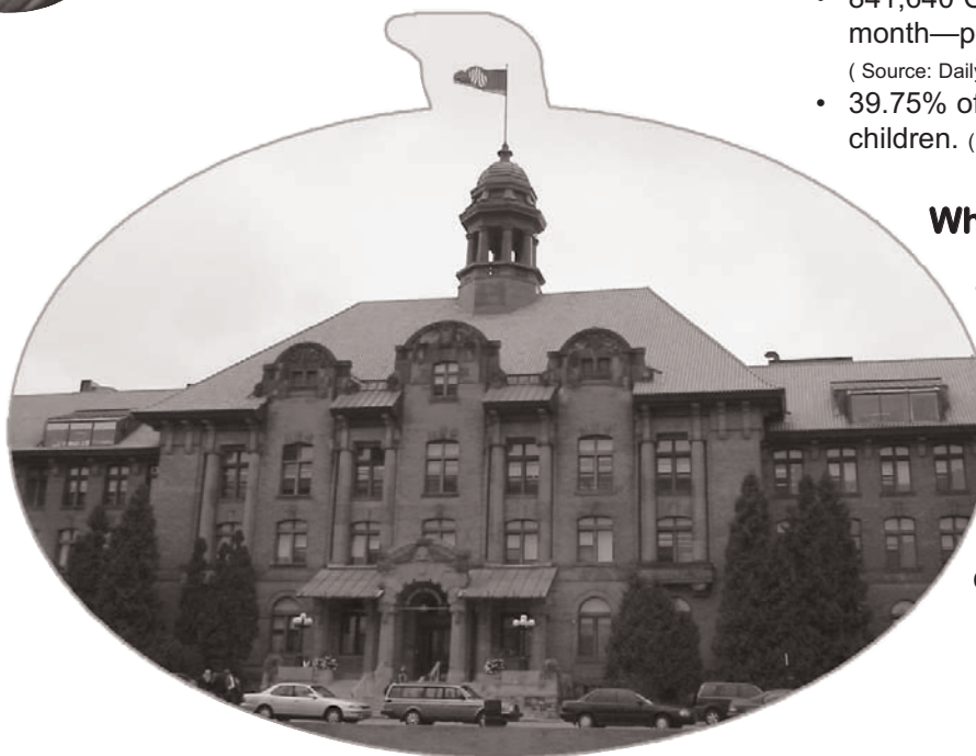
John Abbott College