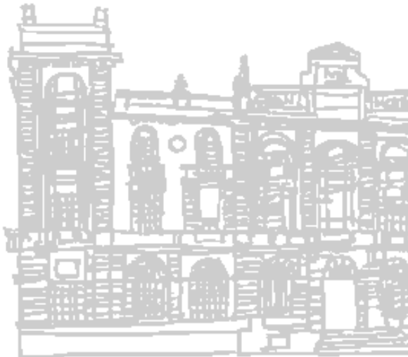
Situación de los cupos de: BARCELO VIAJES S.L.

Podemos imprimir obteniendo este listado.