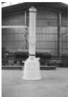
Lavadores de Gases