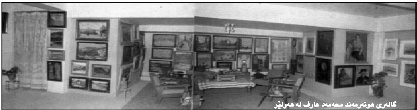
گالەری هونەرمەند محەمەد عارف لە هەولیر

لە سەردانەوہمان بۆ کەوہە هەوار، چوینە خزمەتی. شاهانە پیشوازی لیکردین و کوردانە باوہشی بۆ کردینەو. ئەم گفتوگۆییە لیرە دەخویندريتەو، کەمیکێ کەمە لە زۆری ئەو رازو نیازو